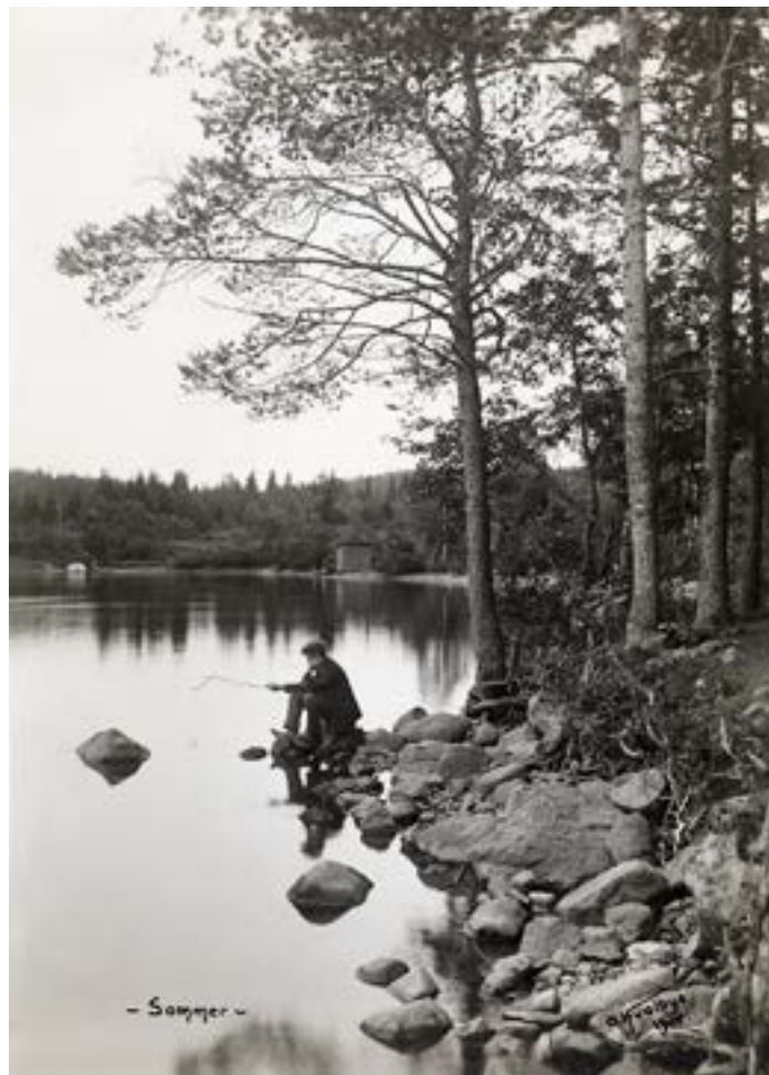
Sommerkveld ved Sognsvann, 1904.

Senere i romanen beskrives en scene hvor ungdommene går hjem mot byen etter hyttetur: