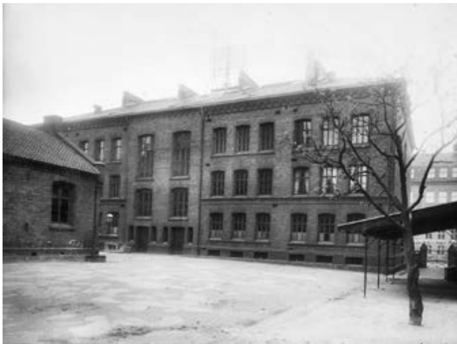
Vaterland skole, ca. 1910.

Det er både likhetstrekk og kontraster mellom de tre andre lærerinnene som nå skal presenteres sammen med