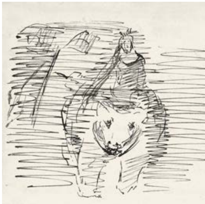
Skisse etter hukommelsen av Kittelsens Kvitebjørn kong Valemon, fra dagboken.