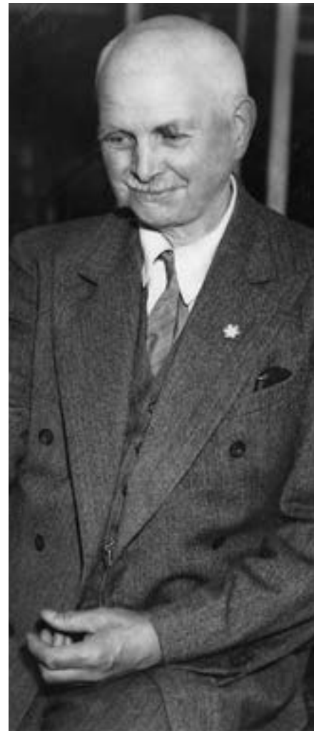
Otto Valstad, ca. 1935.