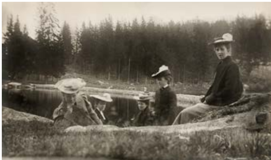
Tur til Besserudtjernet, 1905.

Berner lærte henne å bruke kart og kompass. Han konfererte med henne