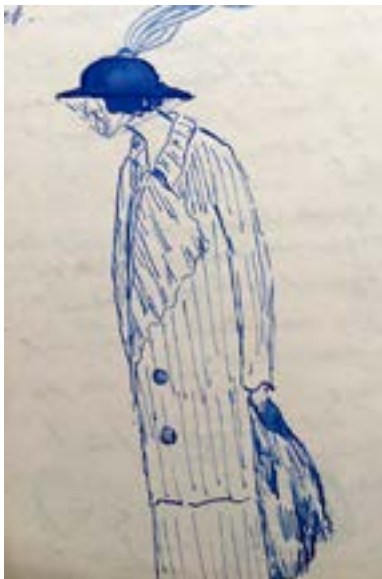
Motetegning fra dagboken