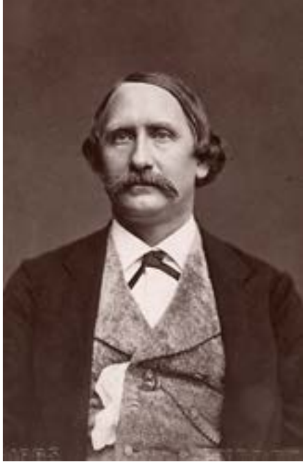
Erik Bøgh fotografert i 1880-årene.