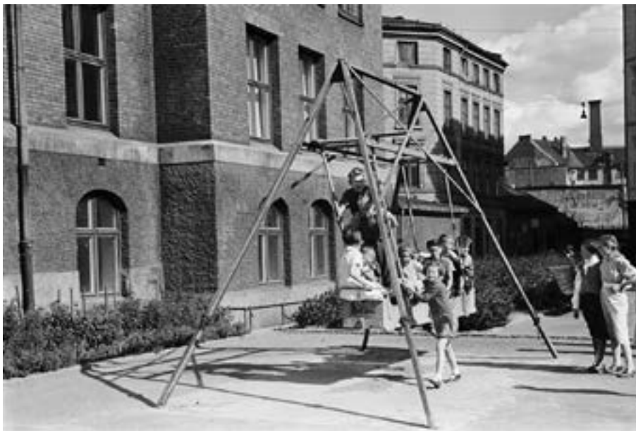
Lekeplassen mellom Vaterland skole og naboen Oslo Elementærtekniske skole, 1938.