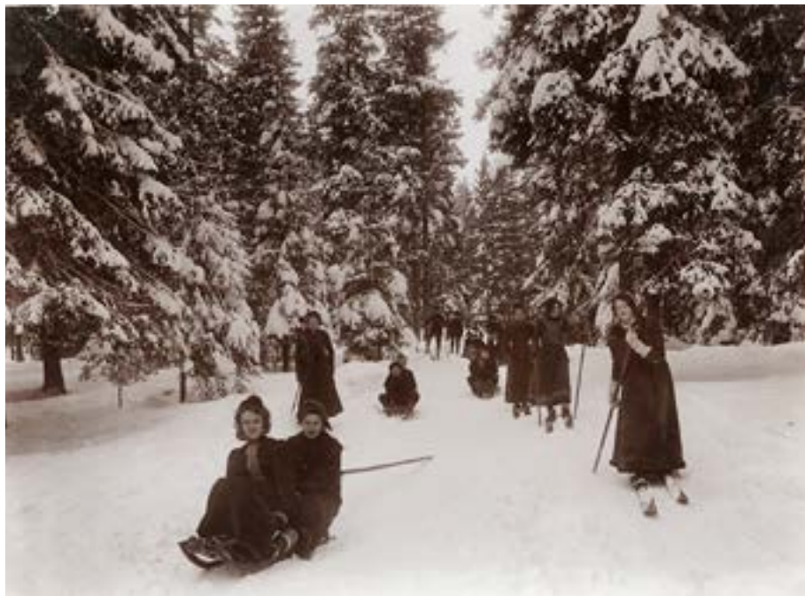
På ski og kjelke i Nordmarka, 1901.

Og jeg stanser og retter på rem mer og ryster mit drivvåte skjørt,