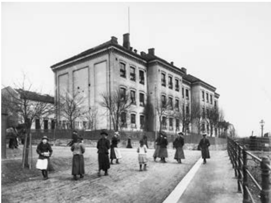
Barn ved Sagene skole, ca. 1910.