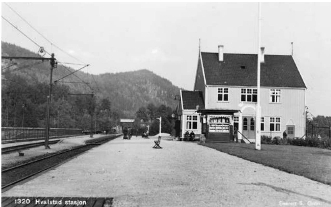
Hvalstad stasjon, ca. 1935.