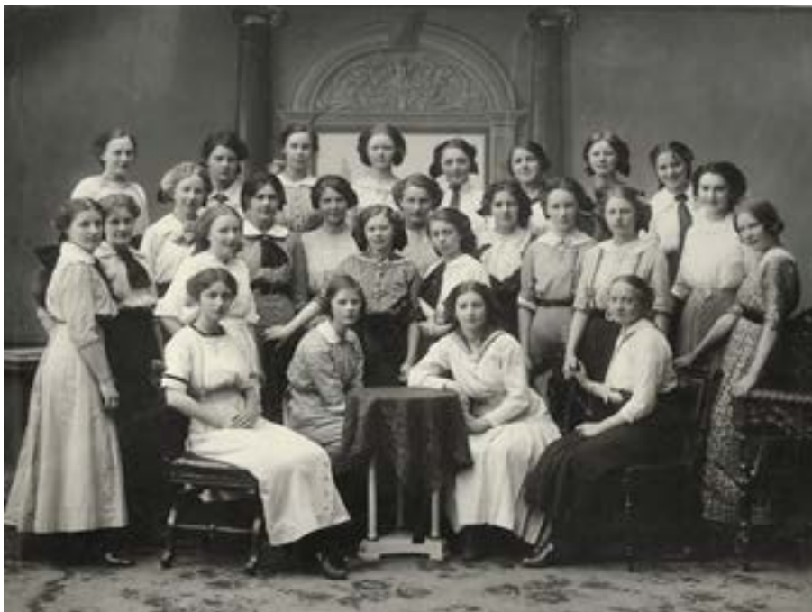
Klassebilde Vestheim skole