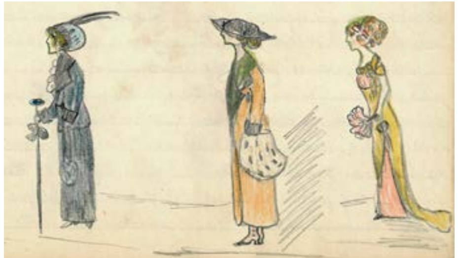
Tegninger fra dagboken