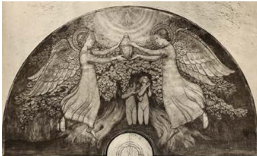
Emanuel Vigelands dekor i Vestre krematoriet.