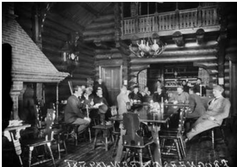
Frognerseieren restaurant, 1895.

De sosiale miljøer som skildres i Undsets romaner og noveller fra