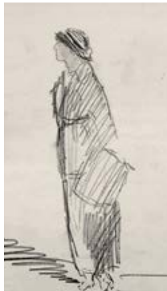
Motetegning av dame med muffe, fra dagboken

Ungdomstiden til Kristine var nok også typisk for en jente som tilhører middelklassen eller den øvre middelklasse. Hun har tid og penger til å gå på teater, kunstutstillinger, kinematograf, restaurant, og skaffe