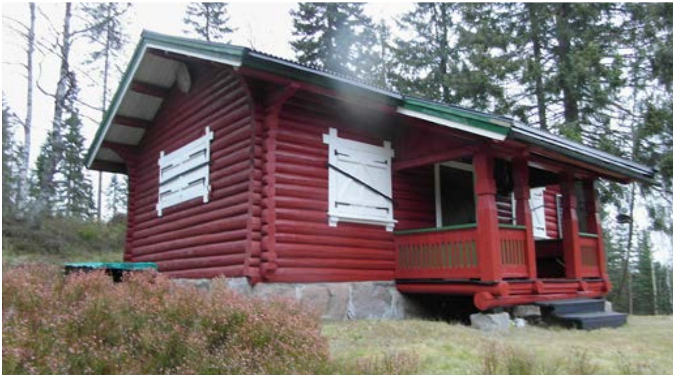
Til venstre: Den unge Sigrid Undset, ca 1900.