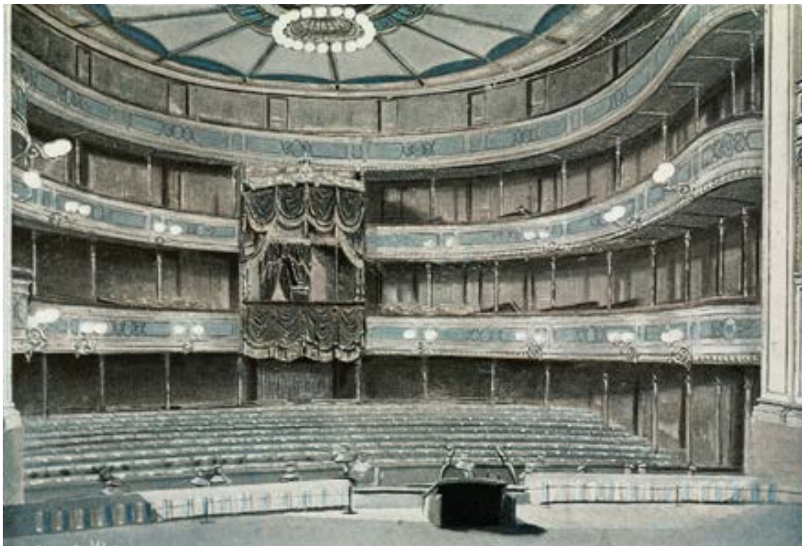
Salongen i Christiania Theater, 1899.

FARGETRYKK ETTER MALERI AV LORENTZ KLEISER/OSLO MUSEUM