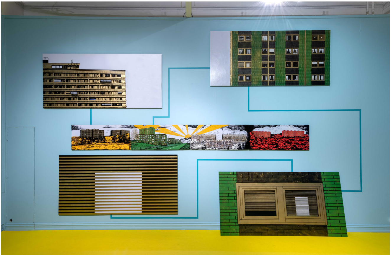
Fra utstillinger på Interkulturelt Museum. Øverst: «Typisk dem». Foto: R. Aakvik / Nederst: «The Golden Wish». Foto: U. Schildt