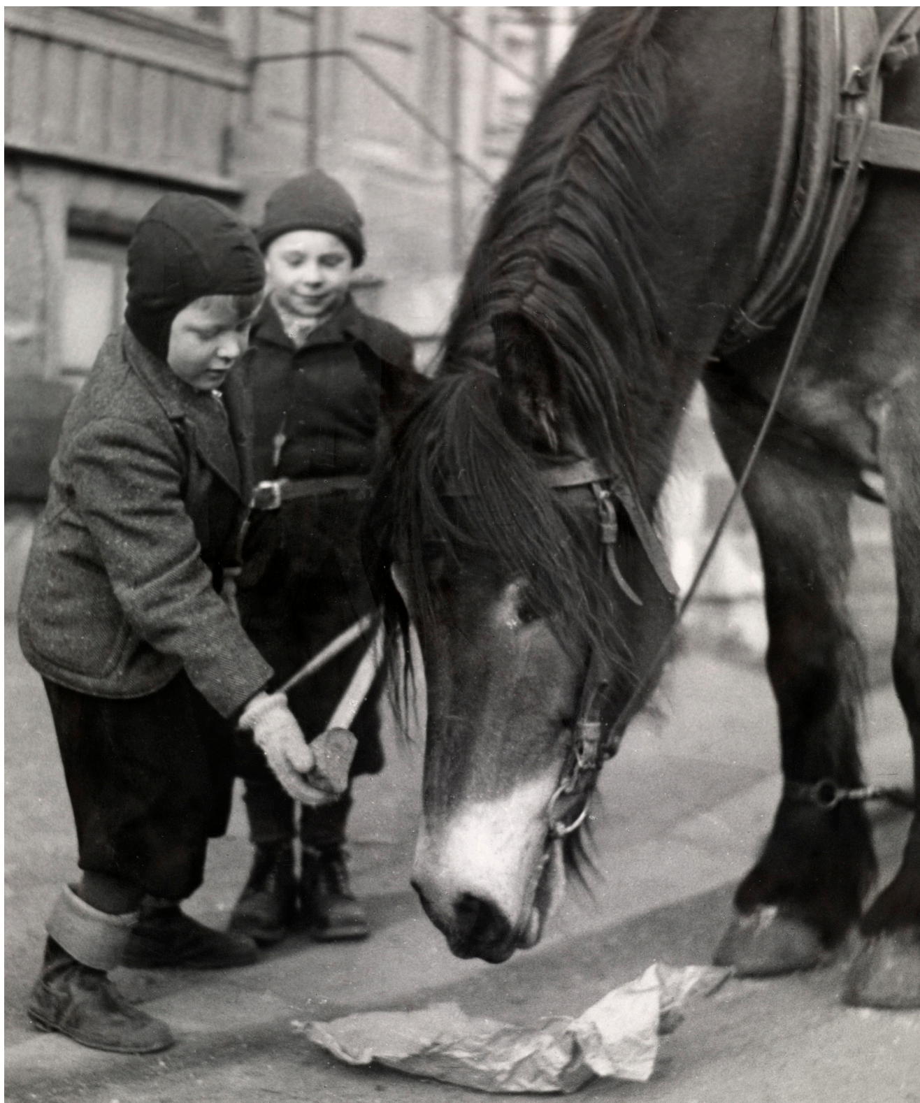
Et av bildene i utstillingen «Dyr i byen». Det var et nært forhold mellom byens barn og byens hester.

Mål: «Museene skal forestå forskning og utvikle ny kunnskap». (Prop. 1 S 2018-2019)