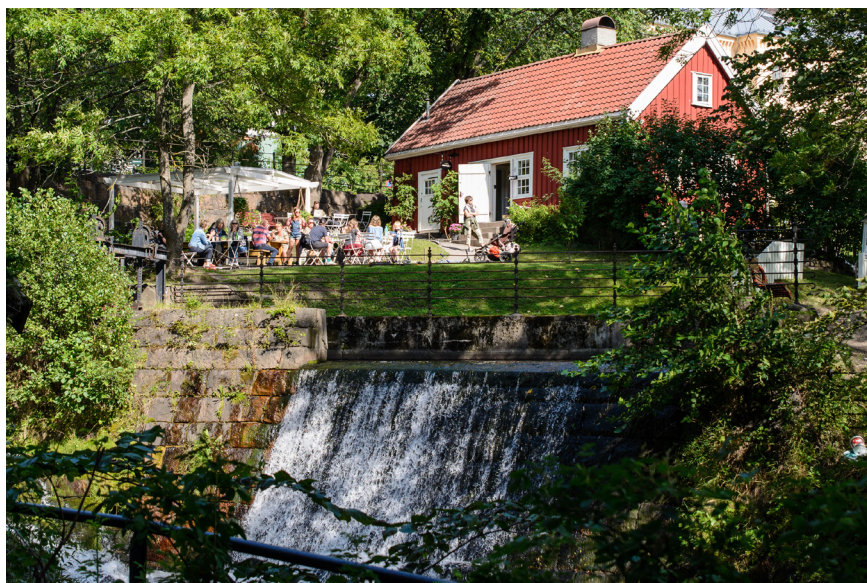
Hønse-Lovisas Hus sommeren 2019.

Totalt har 4461 elever og 179 studenter deltatt i Arbeidermuseets formidlingstilbud i 2019. Dette er 1174 flere enn i 2018. Arbeidermuseets skoletilbud er gratis for Oslo-skolen. I tillegg har 572 VO-elever og voksne fra NAV (772) vært på omvisning gjennom året. Besøket av sommerklasser, som var veldig høyt i fjor, gikk ned i 2019.