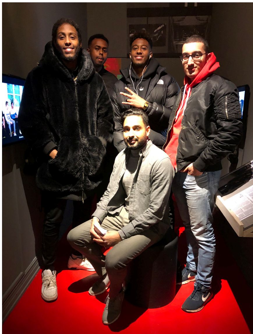
Samarbeidsprosjektet med SID «Lytt til oss, vi har også en stemme» ble sammen med Interkulturelt Museum nominert til NPU-prisen 2019.

praksis, verdi og politisk kraft presentert for publikum gjennom utstilling og en rekke små og store arrangementer. «Karnevalet» undersøker karnevalskulturens opp-ned-perspektiv og sikter på å aktivere nye former for samfunnsdeltakelse, hvor kunstneriske uttrykk og strategier kan brukes til å harselere med og gjøre motstand mot makten. Utstillingen bestod av ulike uttrykk fra innslag som var med i karnevalsparaden i Oslo 3. mars, samt andre prosjekter som ble utviklet og invitert inn i løpet av utstillingsperioden. Til sammen deltok rundt 50 kunstnere i utstillingen, i tillegg ble det lagt opp til deltagelse fra publikum. Vi hadde tre større delåpninger 4. april, 29. mai og 14. september, samt en rekke mindre arrangementer i visningsperioden.