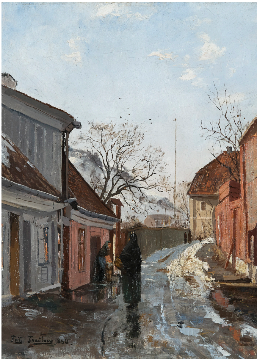
Saxegårdsgate, Gamlebyen. Frits Thaulow, 1880. Et av maleriene i utstillingen «Arbeiderstrøk».

Med utgangspunkt i utstillingen diskuterer vi også samtidens byutvikling og boligpolitikk gjennom omvisninger, foredrag og samtaler. Utstillingen erstattet maleriutstillingen «Akerselva i kunsten», som ble svært godt mottatt av publikum. Utstillingen ble åpnet av