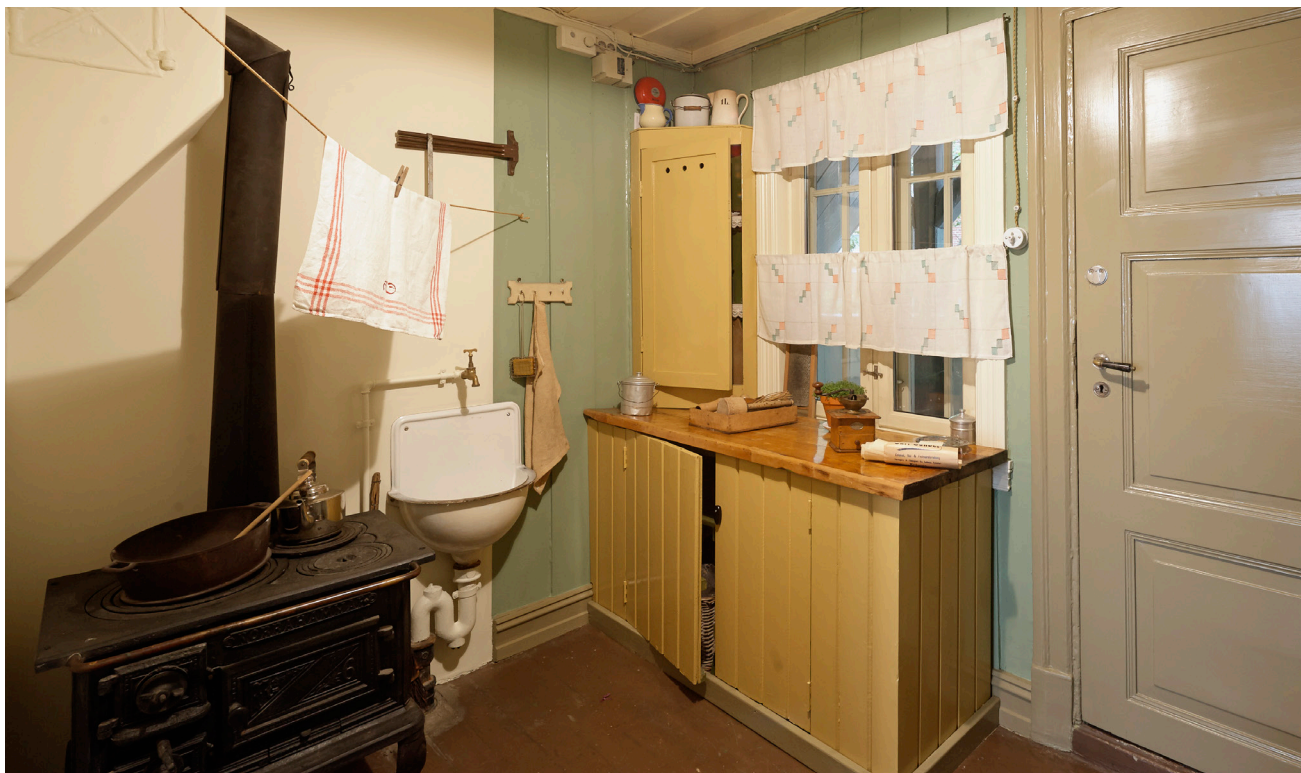
Interiørbilde fra museumsleiligheten i Sagveien 8 som eies av Oslo Byes Vel.

Museet har ikke selv ansvaret for store utvendige vedlikeholdsoppgaver, men holder orden på det innvendige og fører daglig tilsyn med bygningene. Unntaket er Frogner hovedgård, der museet også har ansvaret for de historiske interiørene. Disse er ikke oppgradert på 60 år og har nå tydelig behov for fornyelse. Museet vil utvikle et nytt formidlingskonsept for hovedgården og forsøker å få dette finansiert fram mot 2024. Museets lokaler er sikret med brann- og tyverialarm koblet til brannvesen og vaktelskap.