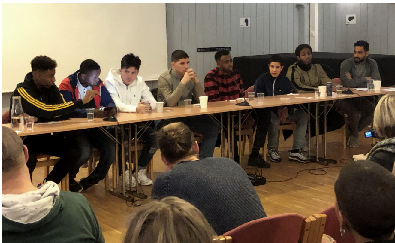
Panelsamtale om utenforskap med ungdommer fra SID (Samarbeid for Inkluderende Dialog), Interkulturelt Museum 28. februar 2019.

Utstillingen ble i 2019 videreutviklet i samarbeid med SID – Samarbeid for inkluderende dialog. SID arbeider med å redusere sosial ekskludering av unge mennesker, utenforskap og med å forhindre rekruttering til uønskede miljøer gjennom dialog, brobygging og å fremme de unges stemme. I samarbeid med museet laget ungdommene i 2019 en film der de forteller om sine opplevelser av utenforskap, men også