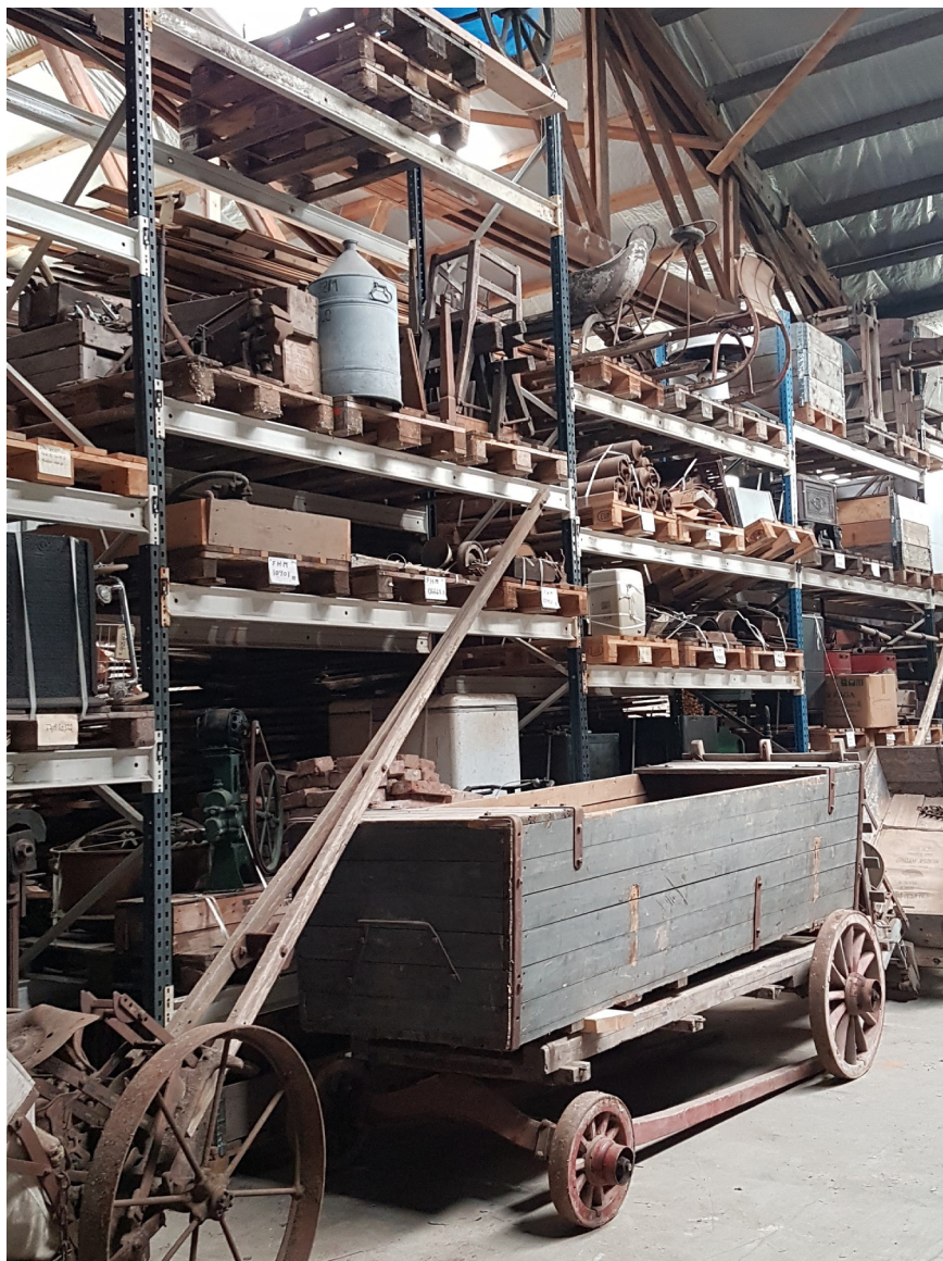
Noe av museets samling i et av de eksterne lagrene det planlegges å flytte fra.

Magasinene er tilnærmet fulle og gir lite rom for videre innsamling. I tillegg leier museet flere eksterne lagre, både i og utenfor Oslo for å avhjelpe plassutfordringer for gjenstandssamlingene. Disse er av varierende kvalitet, og vi arbeider med å finne nye lokaler som kan gi mer og bedre magasin kapasitet. Oslo Museum har stort behov for å utvikle sine magasiner og vil fortsette å arbeide for å finne egnede løsninger, sammen med andre eller alene. Vi søkte midler fra Kulturdepartementet til dette arbeidet for 2020, men søknaden ble ikke innvilget. Behovet gjentas i søknaden om driftsmidler for 2021.