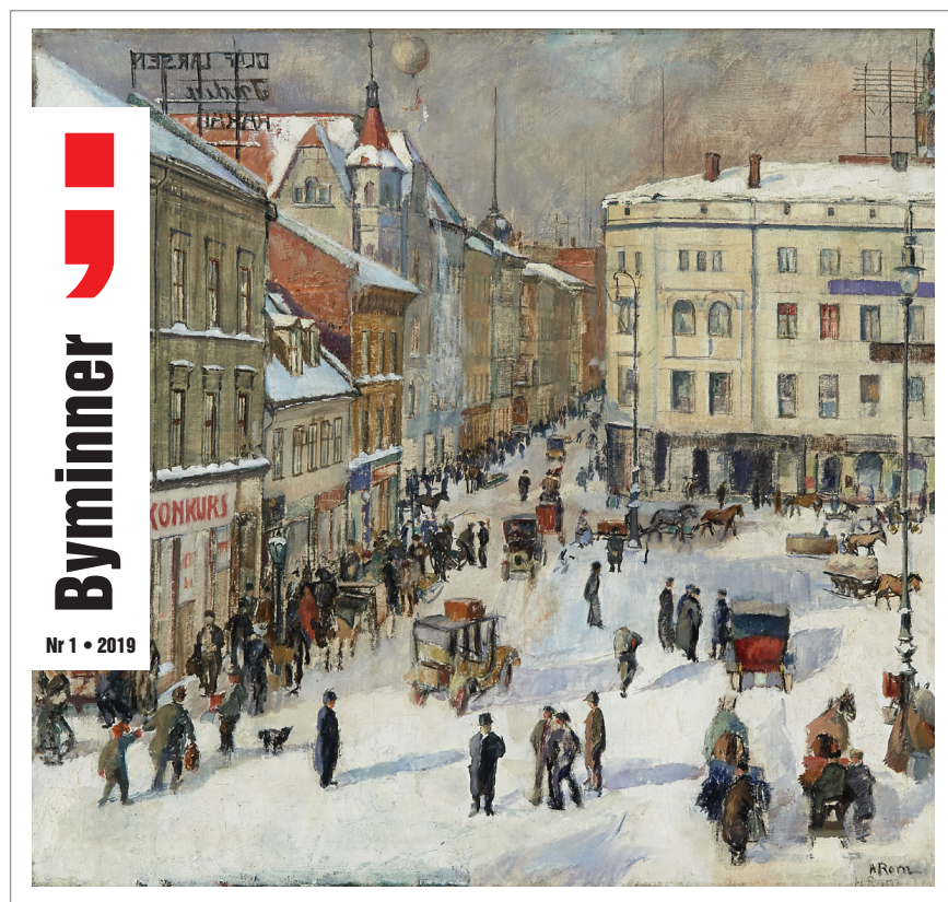
Årets utgaver av Byminner, museets populære vitenskapelige tidsskrift.