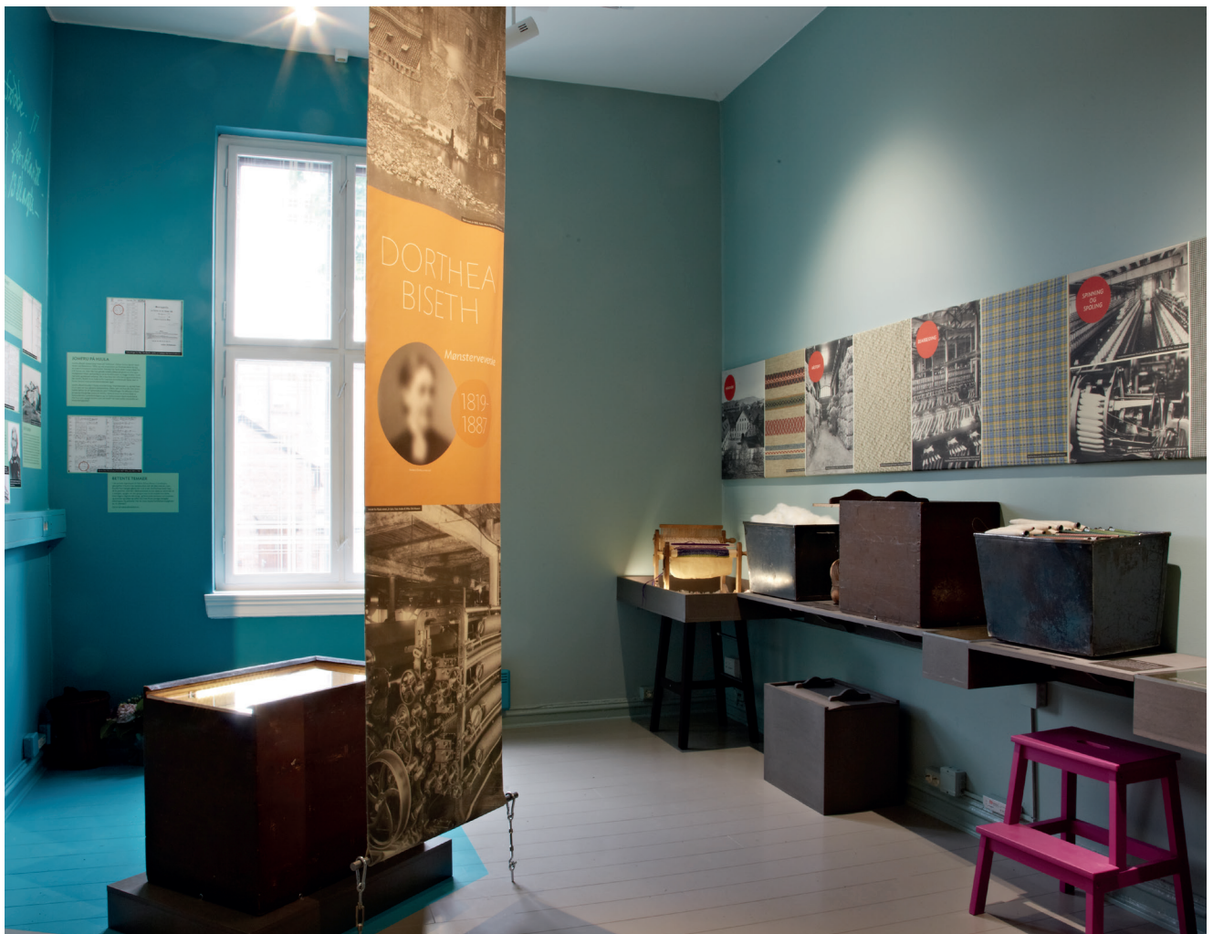
Fra Arbeidermuseets faste utstilling.

Med tilskudd fra UDE ble det i 2019 utviklet et undervisningstilbud for Aktivitetsskolen. Tema var vannkvaliteten i Akerselva før og nå. Opplegget ble svært godt mottatt og vi har søkt Skolesekk-midler for barneskolen for skoleåret 2020 – 2021.