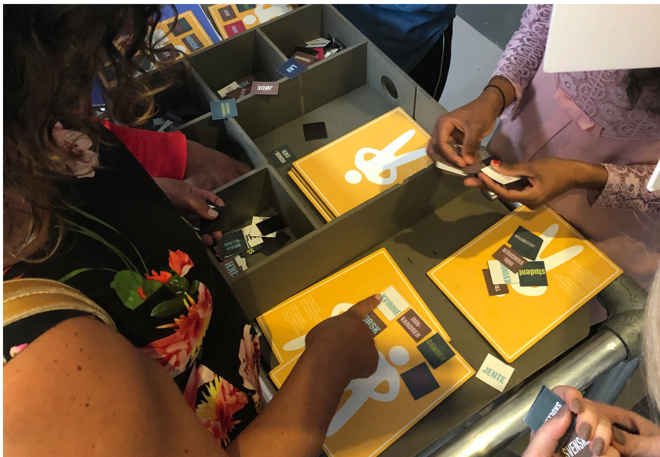
Fra utstillingen «Typisk dem» på Interkulturelt Museum og stasjonen hvor man setter merkelapper på seg selv.

I dette kapitlet redegjør vi for formidlingsmål og -strategier, målgrupper, besøkstall, arbeid med publikumsutvikling, samt ulike formidlingstiltak og konsepter som er gjennomført – utstillinger, byvandring, arrangementer og andre publikumsaktiviteter.