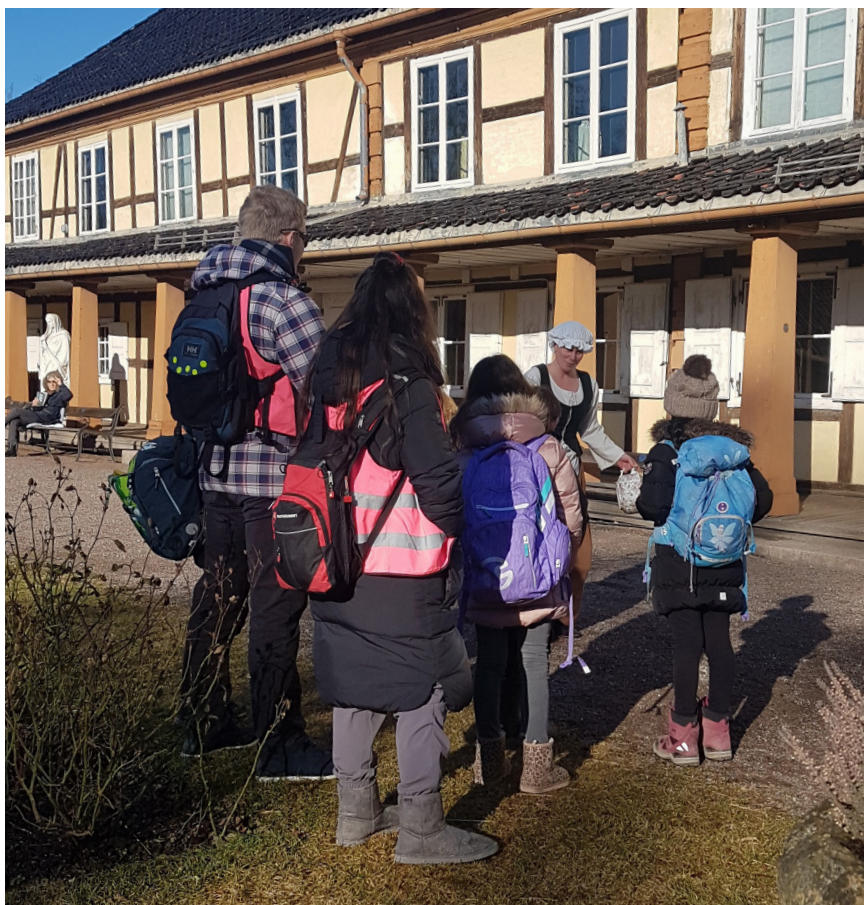
Fra vinterferietilbudet på Bymuseet.

De siste årene har vi også laget tilbud til aktivitetsskolen (AKS) i vinterferien – i 2018 lansert som «Bymuseets junior-klubb» for elever på 3–4 trinn. Tilbudet ble raskt fulltegnet også i 2019.