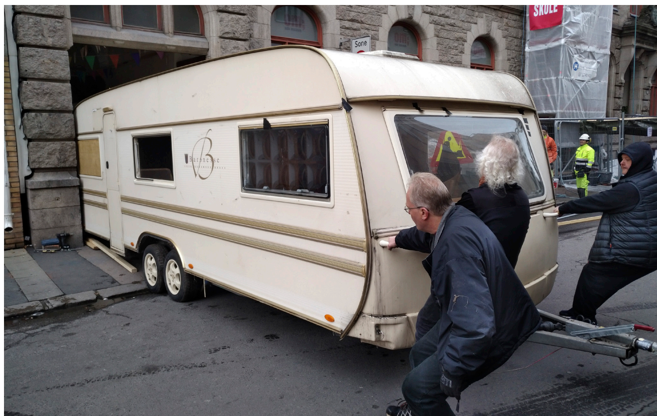
Museets objekt OMug.01067, Baronesse Campingvogn, blir med millimeterpresisjon flyttet fra Interkulturelt Museum til et av museets eksterne lagre.