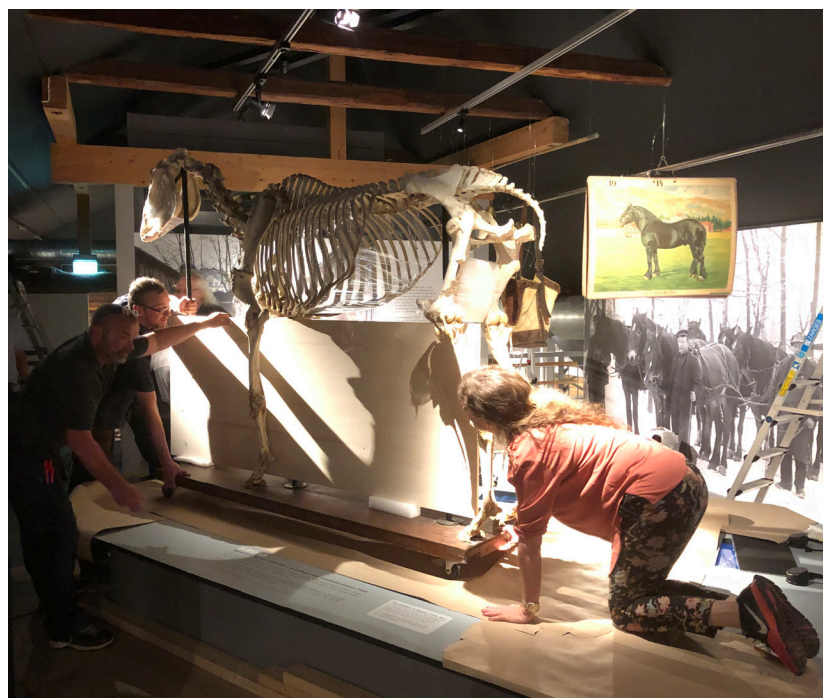
Fra monteringen av utstillingen «Dyr i byen» på Bymuseet.