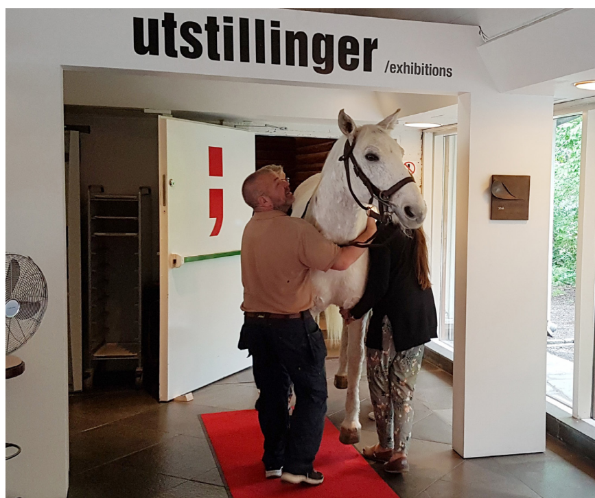
Den utstoppede hesten «Gunnar» som er innlånt til utstillingen «Dyr i byen» blir båret på plass.

I 2019 er det gjennomført førstehjelpskurs og sikkerhetskurs for medarbeiderne som er i førstelinjetjenesten, eller av annen grunn har behov for slik opplæring. I tillegg har flere av museets medarbeidere deltatt på eksterne kurs, seminarer og fagmøter i de nasjonale museumsnettverkene. Aktiv deltakelse i disse nettverkene er prioritert. Medarbeiderne har også fått tilbud om interne fagseminarer og det er gjen-