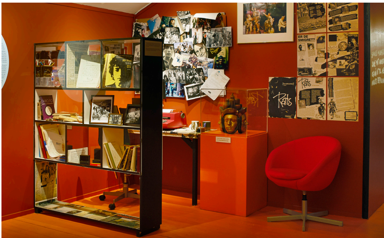
Utvalgte gjenstander, manus og bilder i en seksjon av utstillingen «Tramteatret 40 år!».