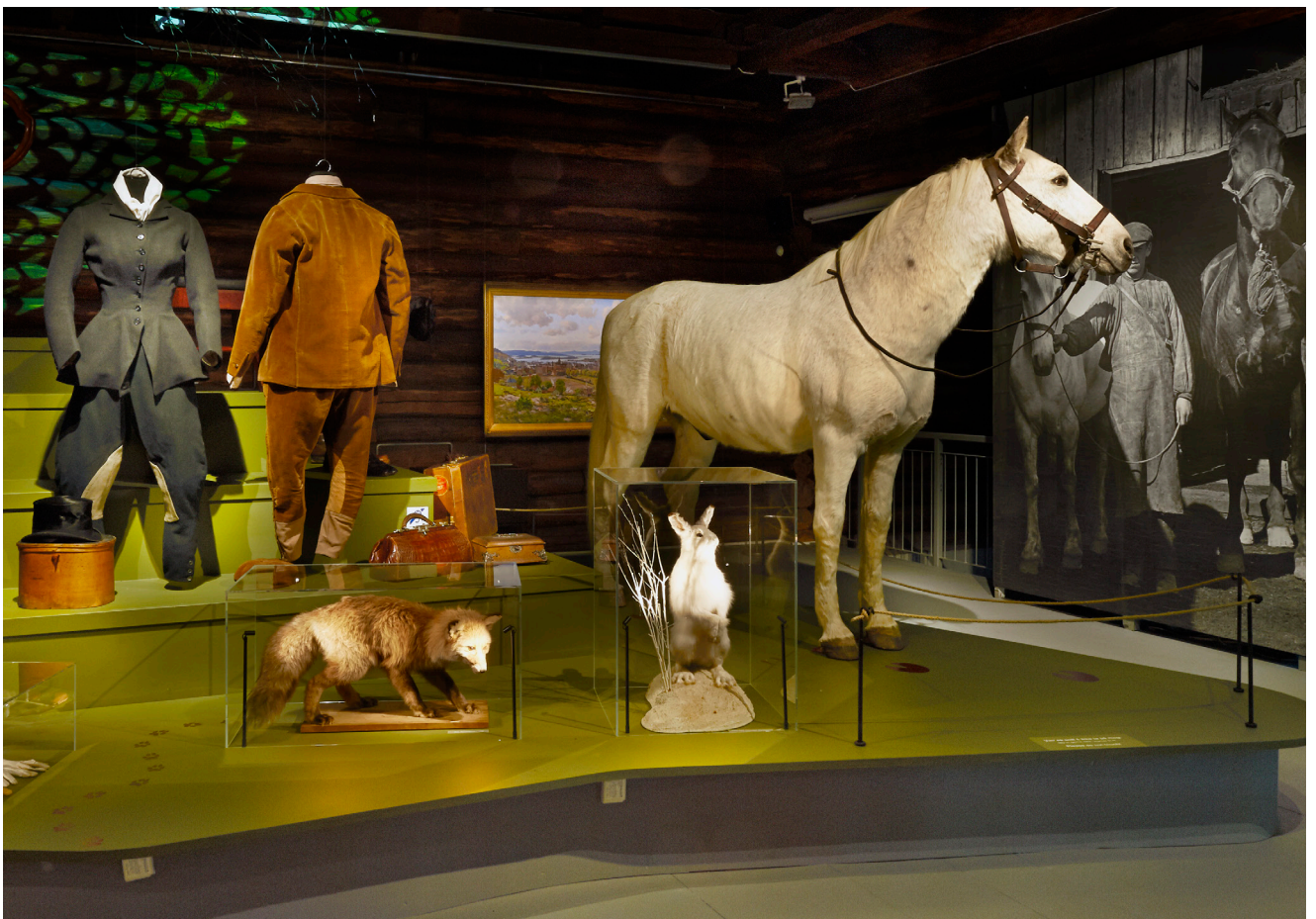
Fra tre av utstillingene på Bymuseet. Øverst t.v.: «OsLove», øverst t.h.: «Søttallet», nederst: «Dyr i byen».