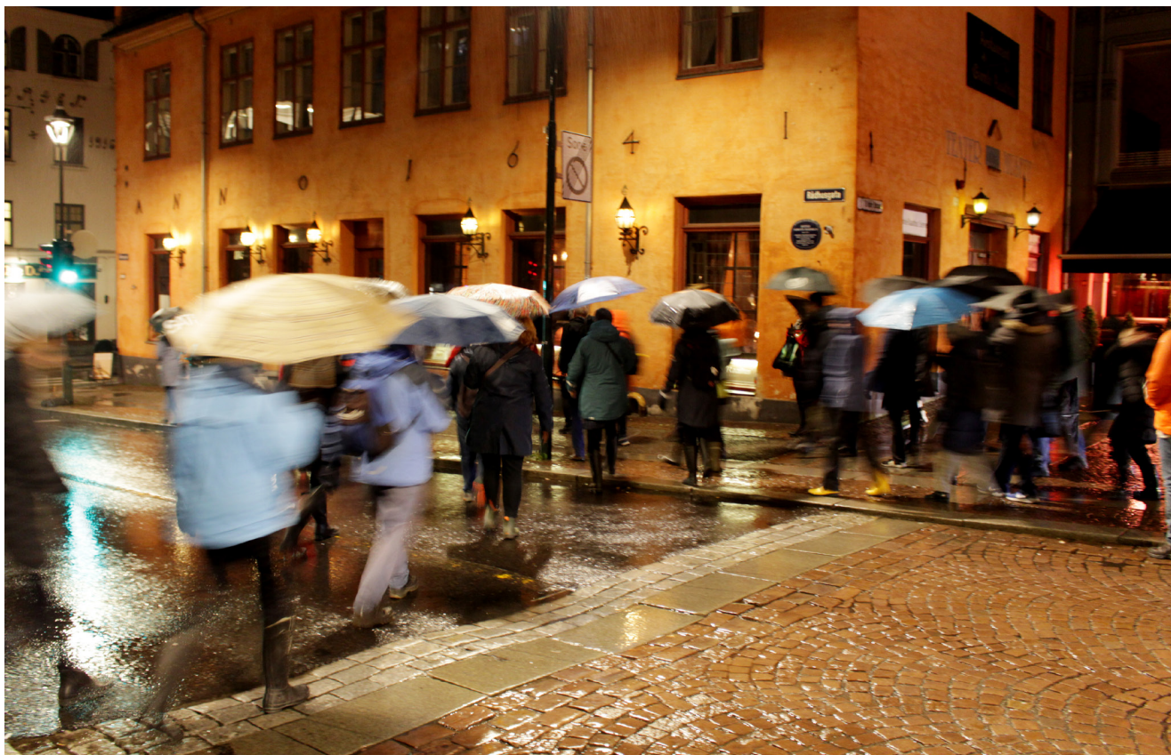
Hele 110 mennesker trosset pøsende regnvær og ble med på byvandring i Kvadraturen 19. november.

Ideen om å etablere en årlig møteplass for historielag, etatsmuseer, foreninger og andre med interesse for byhistorien kom fra museets styre. Seminaret ble i 2019 arrangert for annen gang, og som sist i samarbeid med Byarkivet