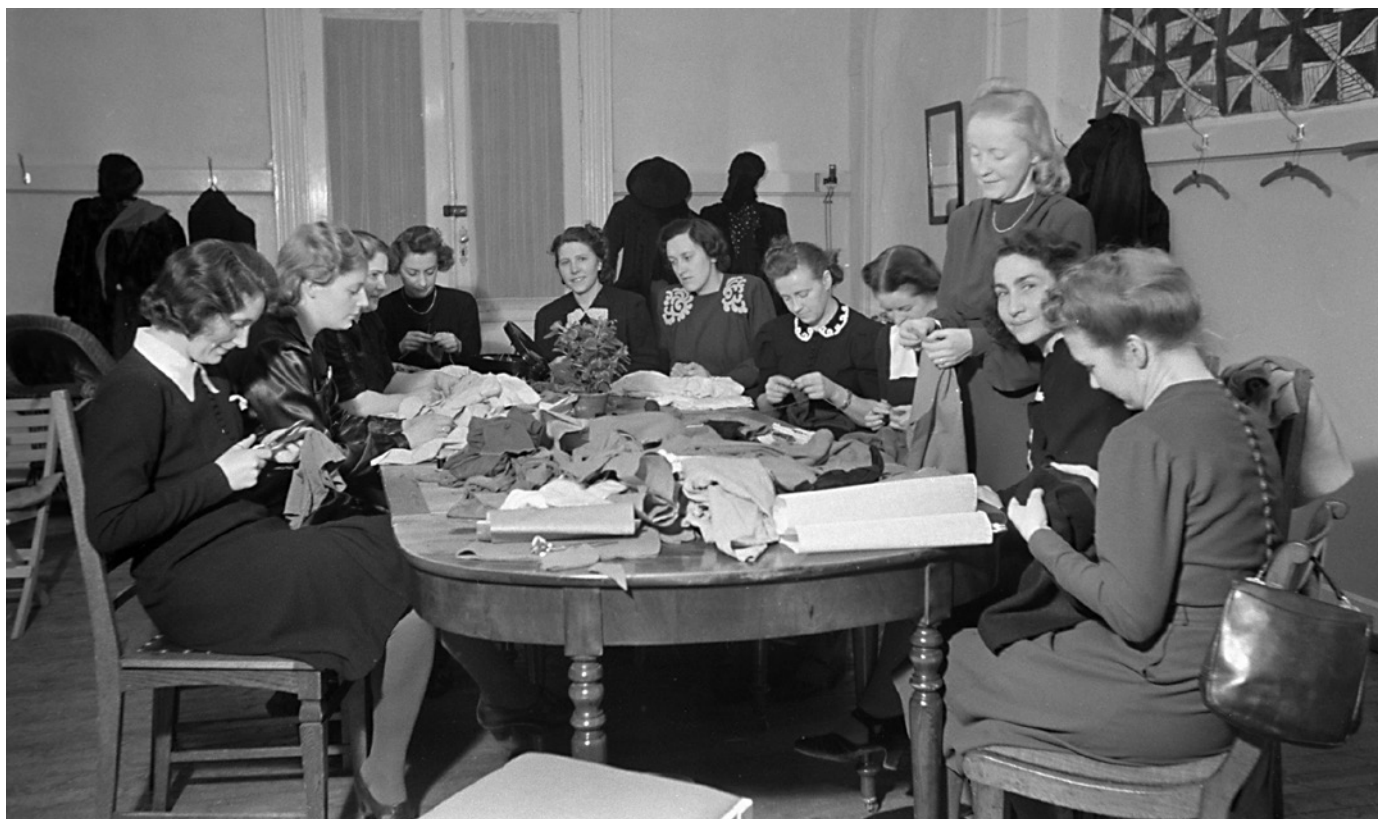
Kurs i lapping av klær. Tøyen, 1943.

Krig snur tilværelsen opp ned. Krig kan virke konserverende, krig kan virke radikaliserende. Krig split-