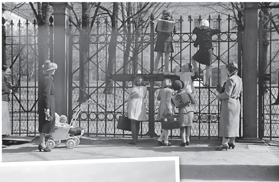
Får vi et glimt av de kongelige? Bak Slottet, 1939.