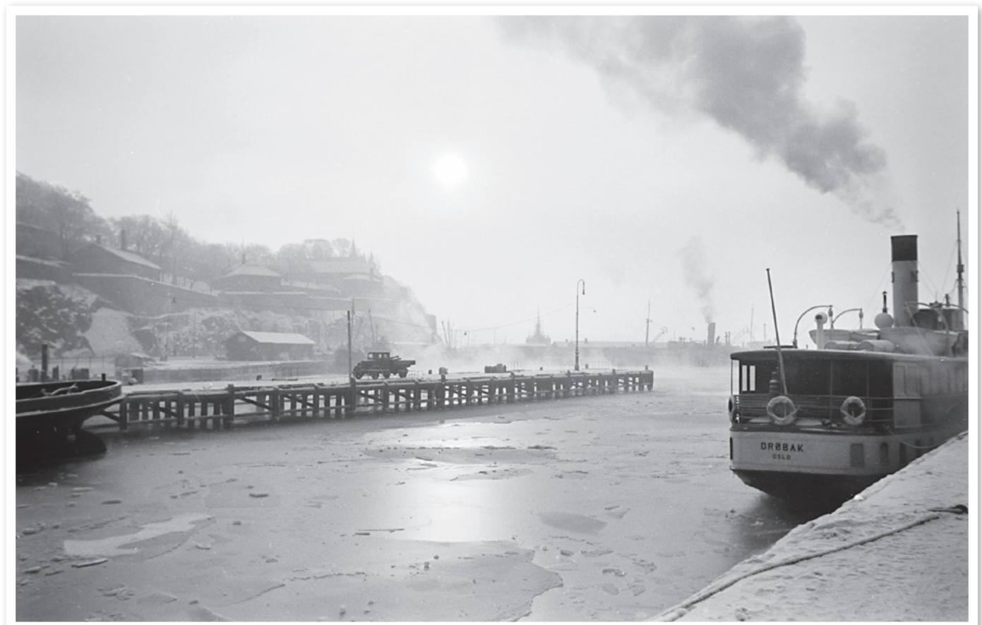
Vinter ved Rådhusbryggene, 1940.