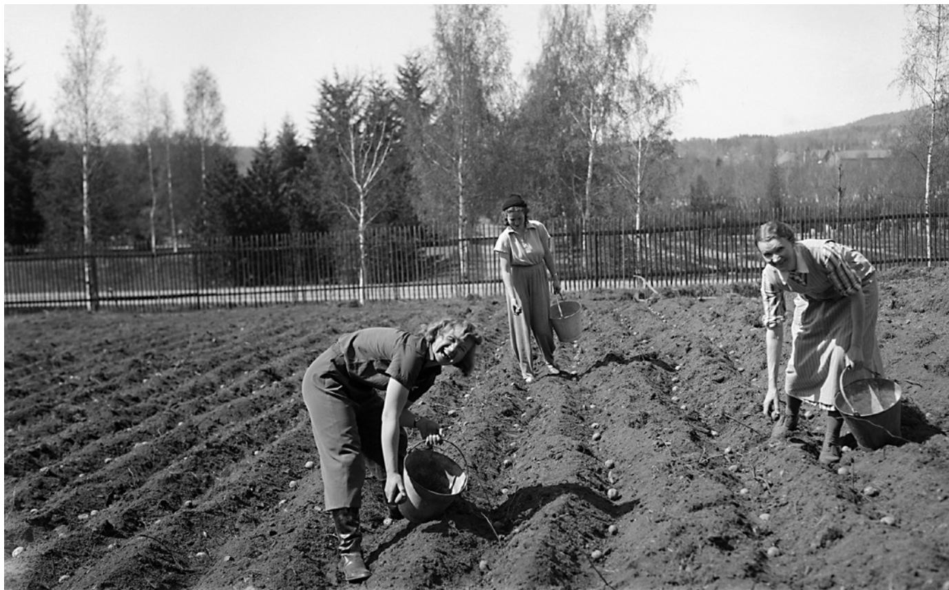
Potetsetting på Volvat – på selveste 17. mai 1940.

Poteter var tilbehør eller hovedrett alene; de ble kokt, stekt, moset, opppedd, spist kalde eller varme. Poteter ble knadd inn i margarin, brøddeig, kakedeig og i vafler og reddet mang en spikersuppe. Med litt kunstig farge...vips! så sto «smør og egg» på bordet. Allment var erstatningspro-