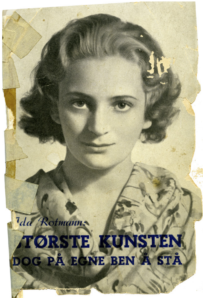
Idas bok «Største kunsten dog på egne ben å stå», utgitt på eget forlag i 1939.