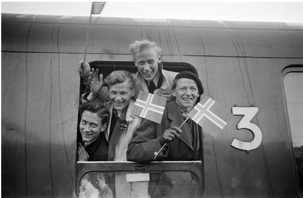
Studentenes hjemkomst fra fangenskap i Buchenwald, 1945.