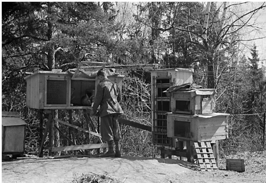
Kaninhold i stor skala på Sæter, 1940.

Noen arbeidsplasser ble økonomisk i stand til å delta substansielt i fremskaffelse av mat. Avishuset Aftenposten ytet regelmessig matvoter til sine 1027 ansatte og deres