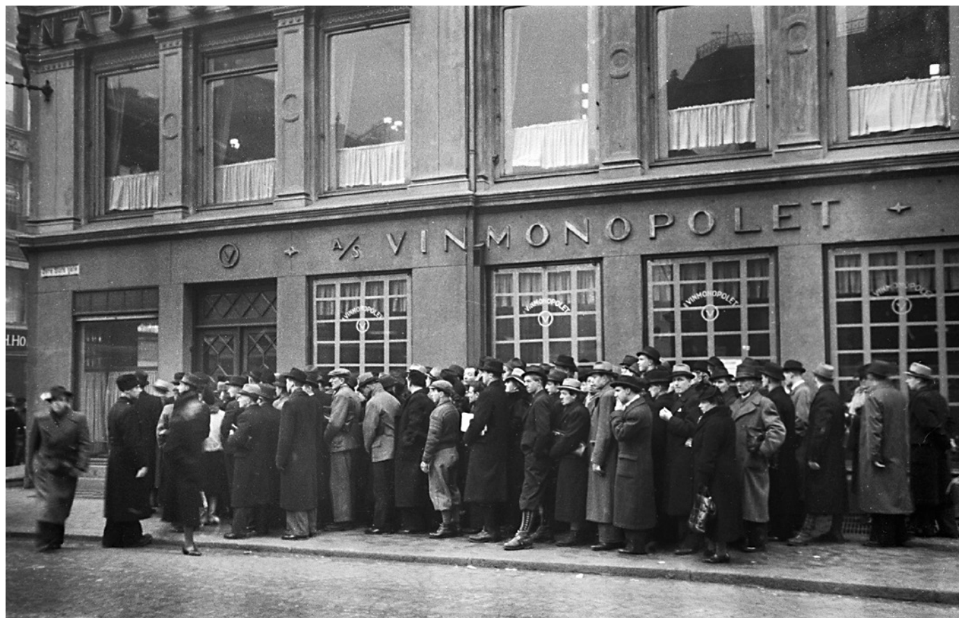
Flest menn i køen ved Vinmonopolets utsalg i Øvre Slottsgate 21, 1940.

Familier summerte merker og rasjoneringskort og sto i kø. Kvinner var