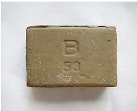
B-såpen til kroppsvask var et av krigens mest kjente erstatningsprodukter.