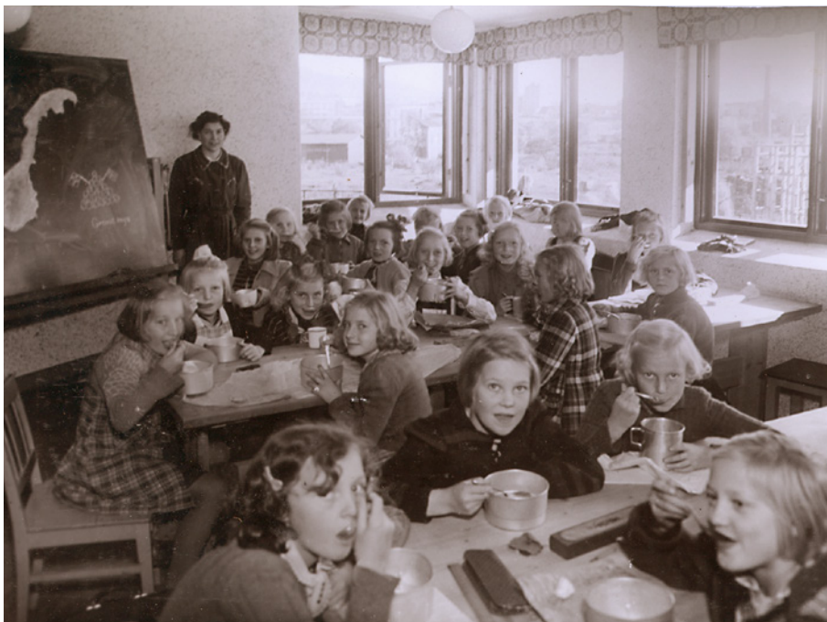
Elever fra Bjølsen skole måtte flytte utenfor bygrensen, til Christiania Spigerverks lokaler i Nydalen. Her inntas danskesuppen i det provisoriske klasserommet, ca. 1944.