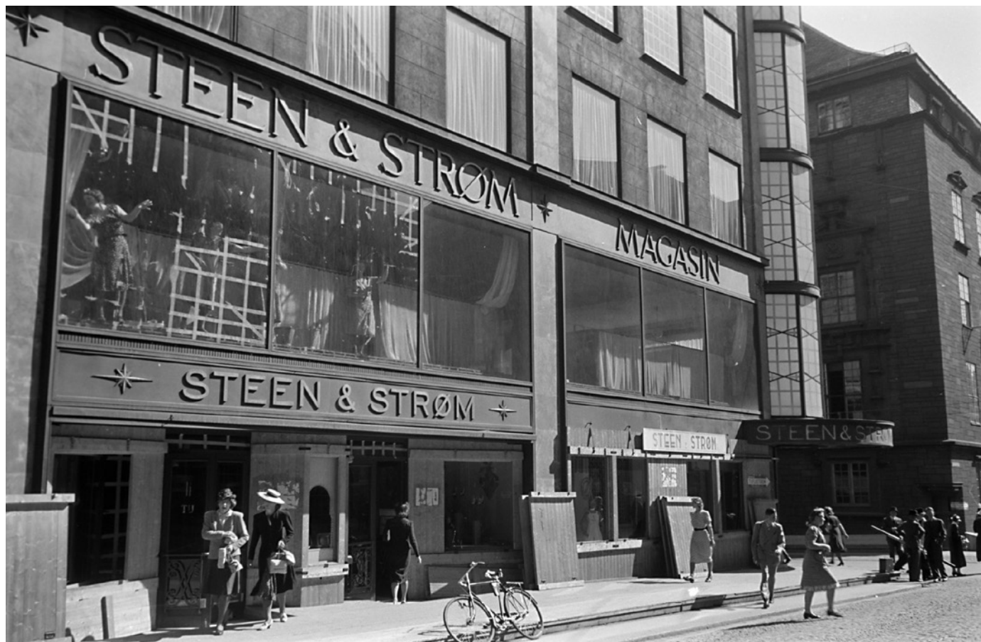
Trelemmer til beskyttelse av utstillingsvinduene og sikring av vindusflater med tape hos Steen & Strøm, august 1940.