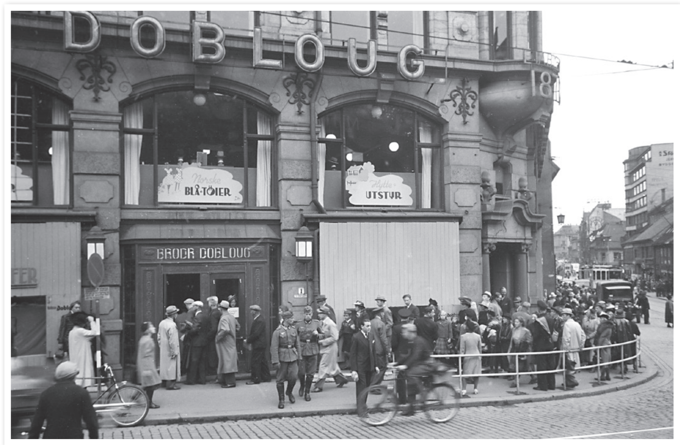
Kø ved Brødrene Dobloug i Storgata 1, høsten 1940.