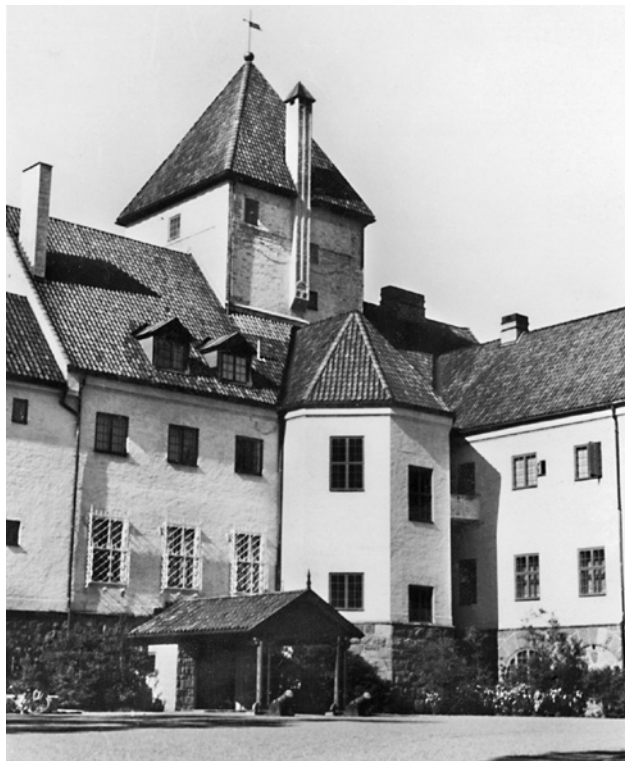
Villa Grande på Bygdøy fotografert i 1962.

Det best bevarte bygningsmonument fra krigsårene i Oslo er imidlertid Quislings «Gimle», den store borglignende murbygningen ved Huk. Villaen het egentlig «Villa Grande», et navn den fikk igjen etter krigen. Nå holder Senter for studier av Holocaust og livssynsminoriteter (HL-senteret) til her. Siden 2005 har huset blitt rehabilitert og innredet for dette formålet. Men fremdeles rager Gimleborgens tårn over trærne på Huk, synlig fra store deler av byen, fra øyene,