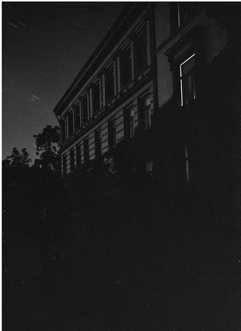
Bare en liten lysstrime slipper ut fra et vindu i denne bygården som ellers er mørklagt med blendingsgardiner, 1940.

9. april 1940 blir Norge okkupert av Tyskland og kl. 14.00 overgir politimester Welhaven i Møllergata 19 Oslo til okkupasjonsmakten. Utover ettermiddagen samme dag, er Oslo-folk vitne til at tyske avdelinger inntar sentrum, med politieskorte. Samme