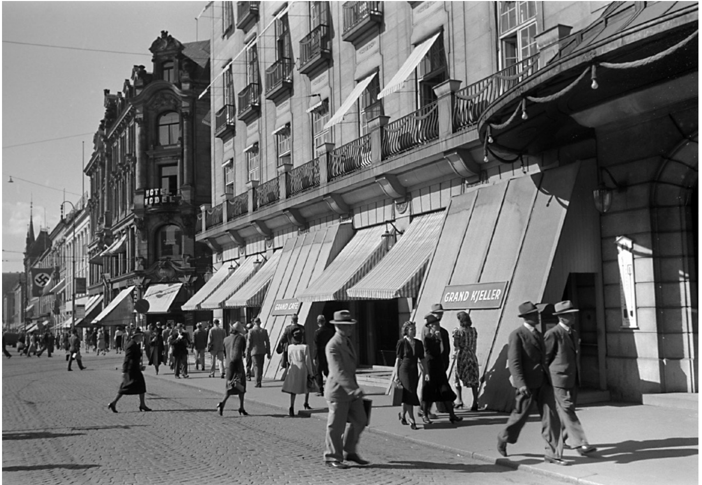
Livet går sin gang på Karl Johan, august 1940.