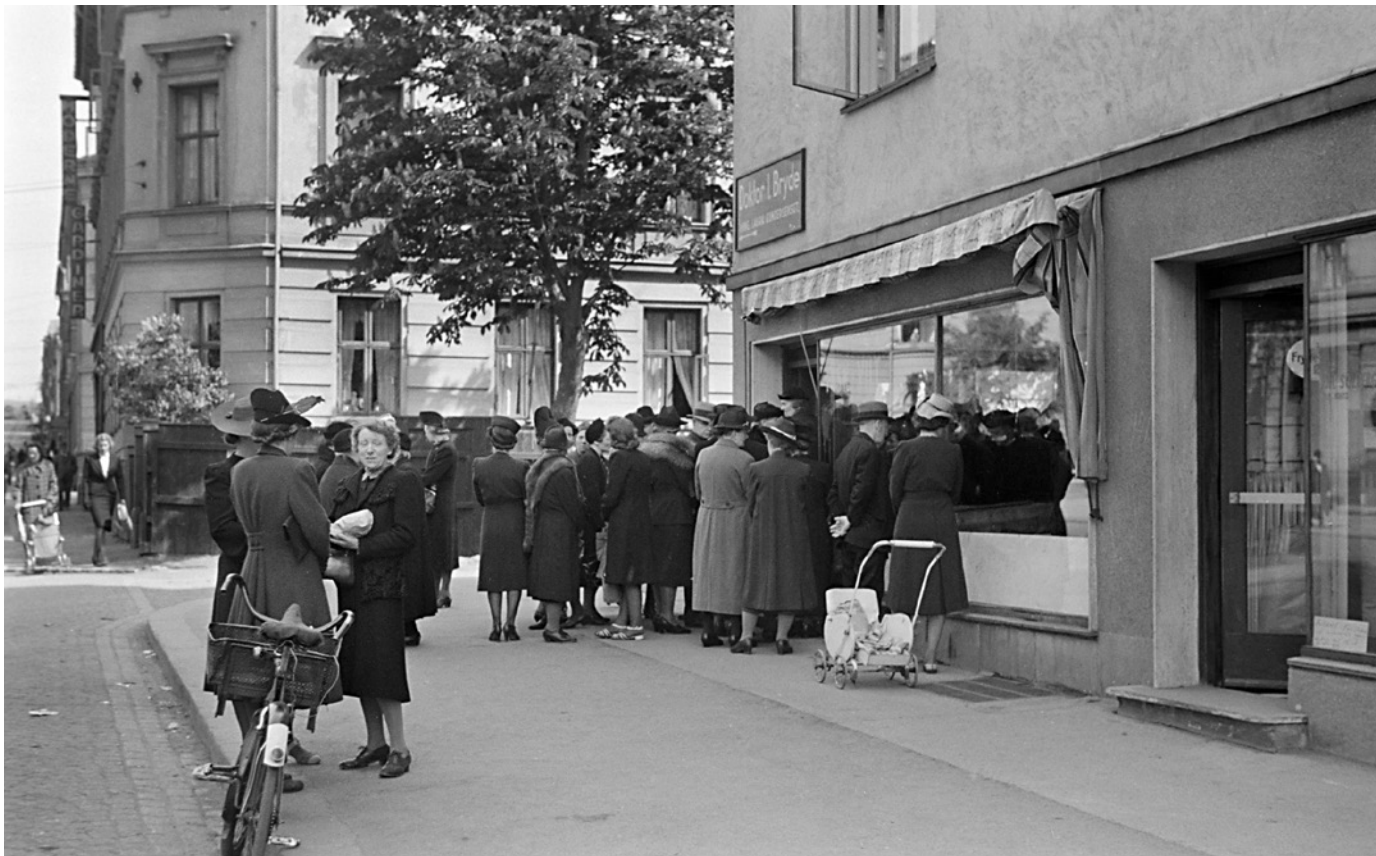
Kø ved Bislet fiskeforretning i Thereses gate 44, 1943.