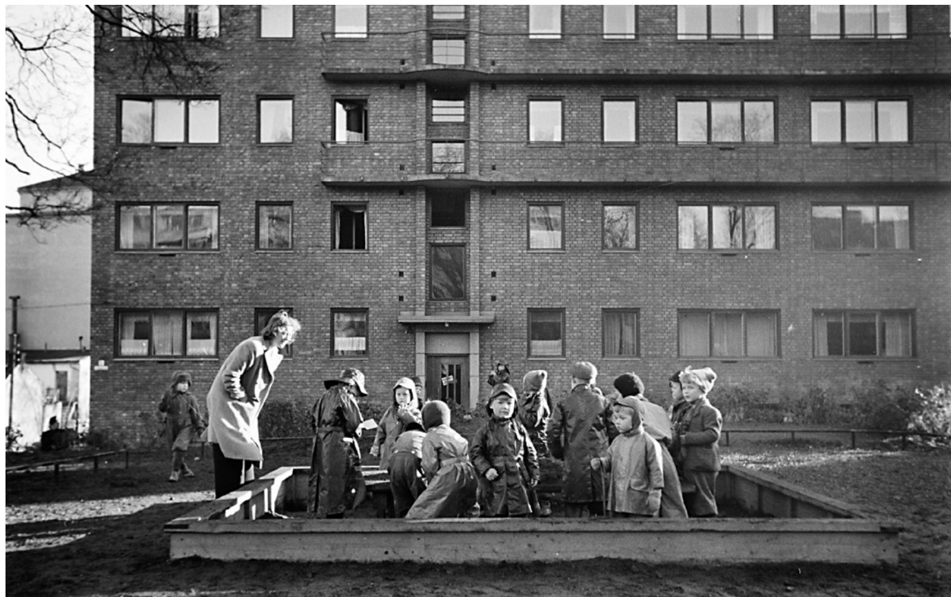
Barn leker i sandkassen ved Holmboes gate 7, 1941.

Tvungen bruk av blendingsgardiner gjør bygatene mørke og uframkommelige. Flyalarmene skremmer voks-