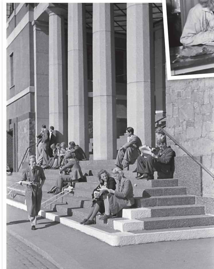
Høstsol på Deichmantrappen, 1940.