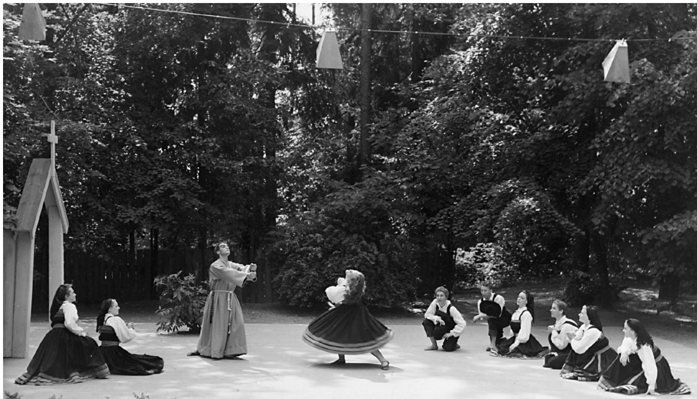
Ny Norsk Ballett på Norsk Folkemuseum med forestillingen «Mot Ballade.»