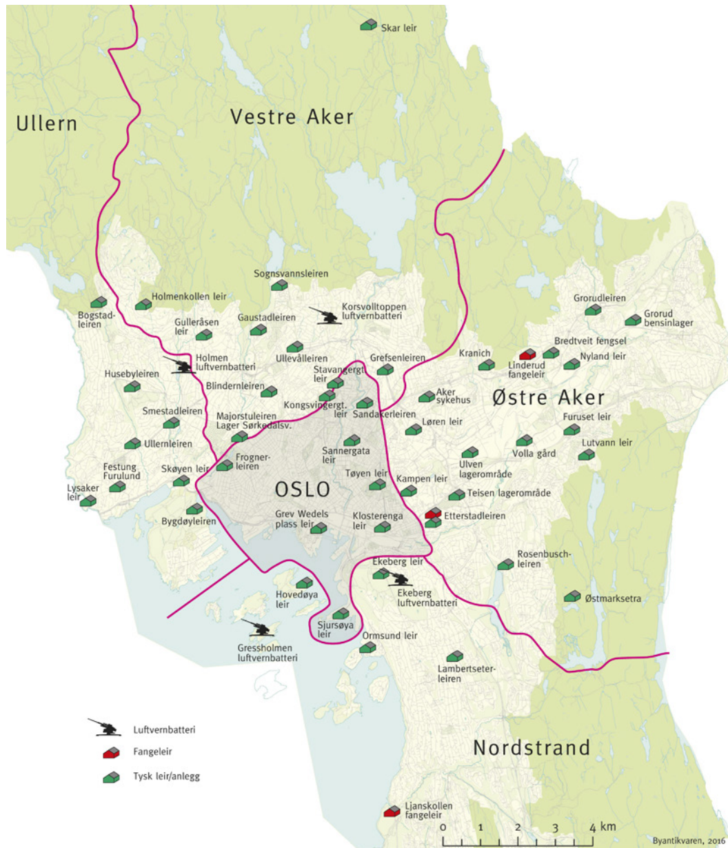
Kart over tyskernes anlegg i Oslo og Aker under okkupasjonen.