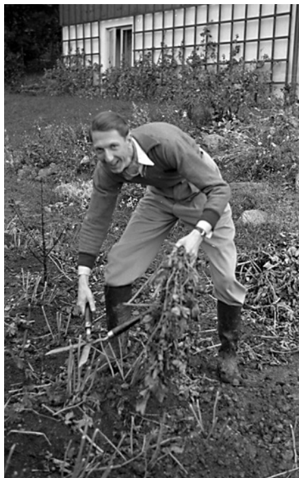
Leif Juster hjemme i hagen på Røa, 1942.

beretter en del om hvordan Oslo-revyene så på forklaringsrammene i landssviksakene. 10 Paul Gjesdahls kommentar om at «Quislinger er bare motbydelige» viser til en meget presset tid, en tid sterkt preget av krigens grusomheter og tosidighet. 11 Dette er noe som ofte vil prege en fred, noen har tapt og noen har vunnet. I denne sammenheng knyttes det til et stort antall menneskeliv som har blitt torturert, drept og endt i ett av verdens verste masse mord gjennom tidene. Etterkrigstiden var blant annet ei tid for beskrivelser av det meningsløse og totalt uforståelige, jamfør Gunvor Hofmos «Gud, hvis du ennå ser: / det er ingen hverdag mer.» 12 Revyvisene tok opp i seg noe av det, men måtte videre, på humorens premiss.