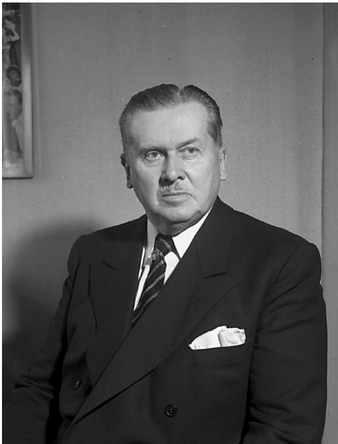
Axel Otto Normann, teatersjef ved Nationalteatret fra 1935–1941, og fra 1945–1946.