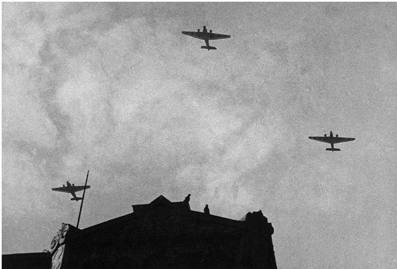
Tyske fly over Stortinget om morgenen 9. april 1940.

get vaiet fra flaggstangen på taket, og fasaden mot Eidsvolls plass ble brukt som propagandavegg. Den militære ledelsen med generaloberst von Falkenhorst i spissen etablerte seg i KNA-hotellet og brukte det nybygde