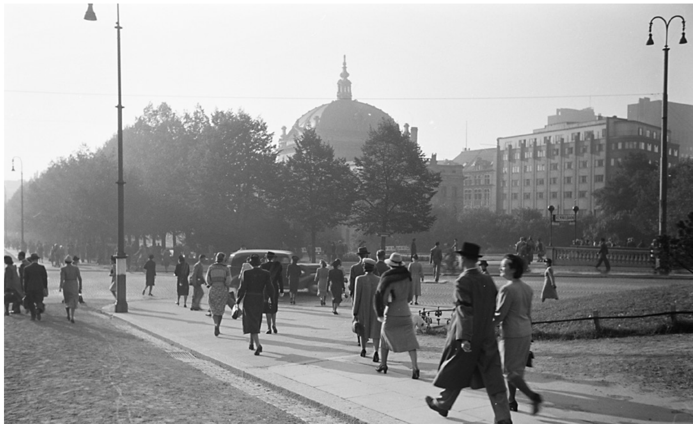
Byen ble ikke bombet, og noen uker senere er livet åpenbart vendt tilbake til det noenlunde hverdagslige for folk som spaserer ned Slottsbakken på vei til arbeidet.

Neste morgen er alt annerledes. Veien til jobben oppleves ikke lenger som trygg. En fremmed militærmakt har inntatt byen. Kjente og kjære steder