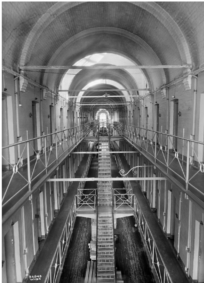
Interiør fra Botsfengselet, 1929.

Påmelding til alle arrangementer: oslomuseum.no/billetter