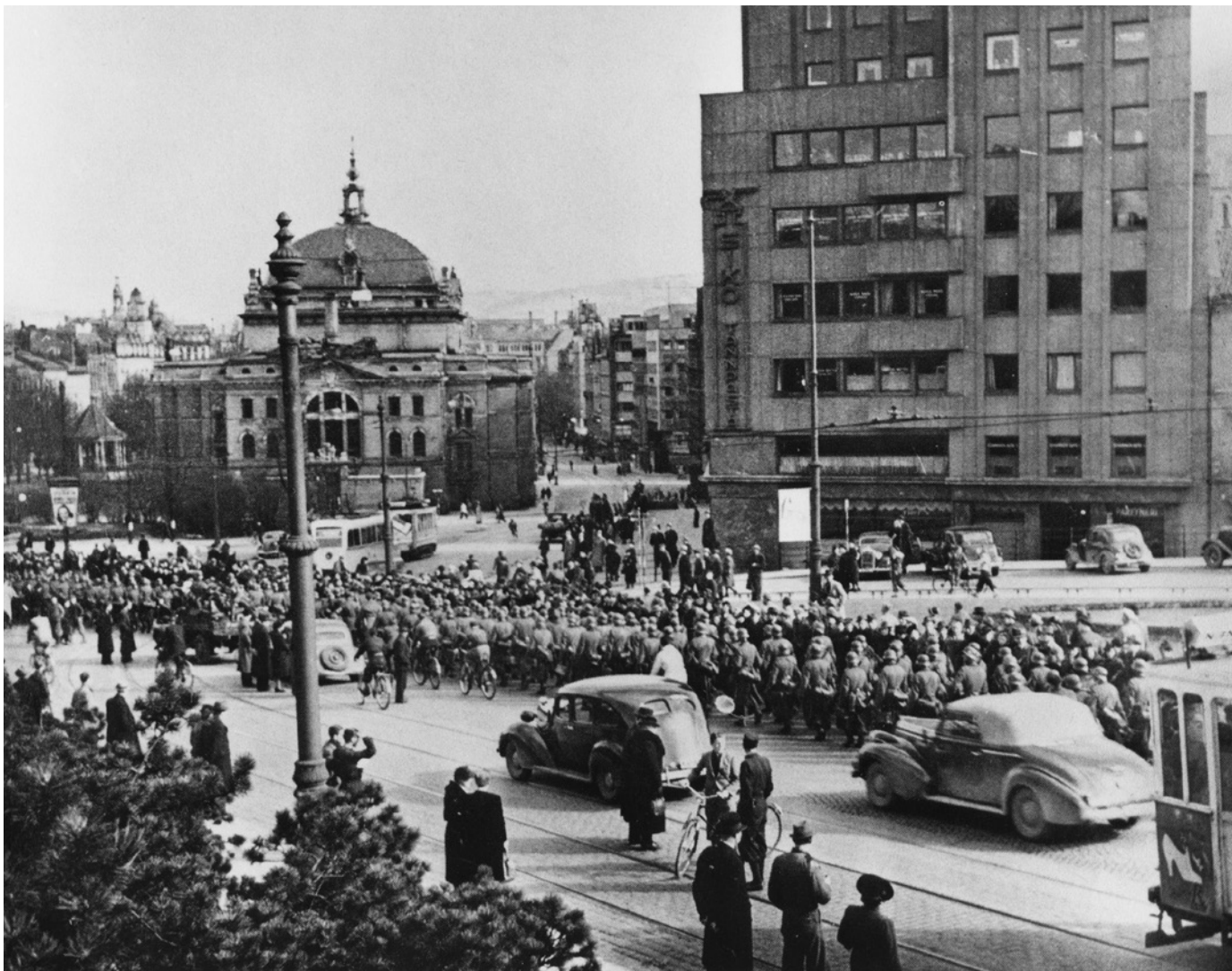
Tyske soldater marsjerer inn i Oslo 9. april 1940.