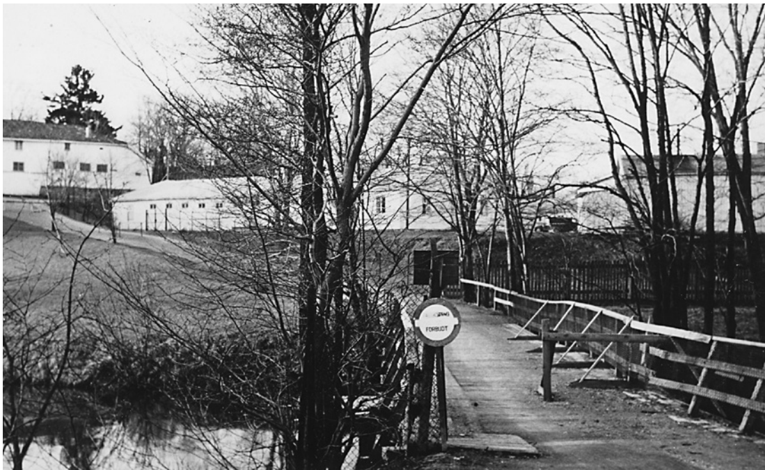
Frognerleiren, rett ved Bymuseet på Frogner hovedgård. Her fotografert i 1955.