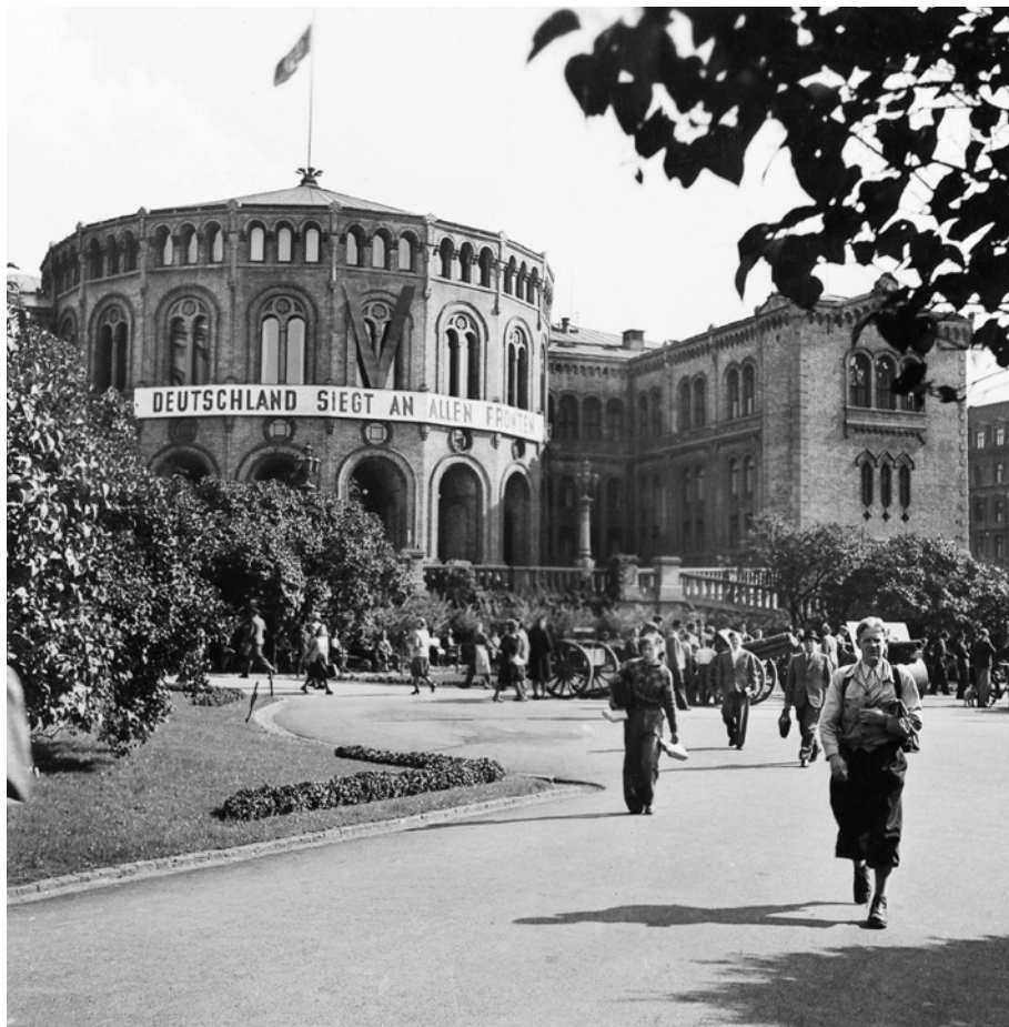
«Deutschland siegt an allen Fronten» på Stortingsbygningen.

Og så begynte krigshverdagen med rasjonering av det meste, mangel på mat og brensel, blanding og flyalarmer, sensur og mangel på informasjon, terror med tortur og henrettelser, men også etter hvert motstand, både sivil og militær. Boligsituasjonen ble etter hvert vanskelig, da det så godt som ikke ble bygd nye boliger, og blokker som var i ferd med å bli ferdigstilt, ble rekvirert av tyskerne. Mange av skolenes undervisning måtte foregå i menighetshus, i andre forsamlingshus, i andre skoler om ettermiddagen eller i private hjem. Idrett måtte drives illegalt. Holmenkollrennene ble avlyst, da Skiforeningen ikke ville delta i et nazifisert arrangement. På toppen av Holmenkollbakkens fartstårn ble det isteden