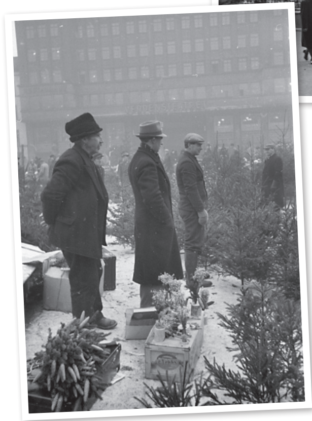
Juletesalg på Youngstorget, 1940.