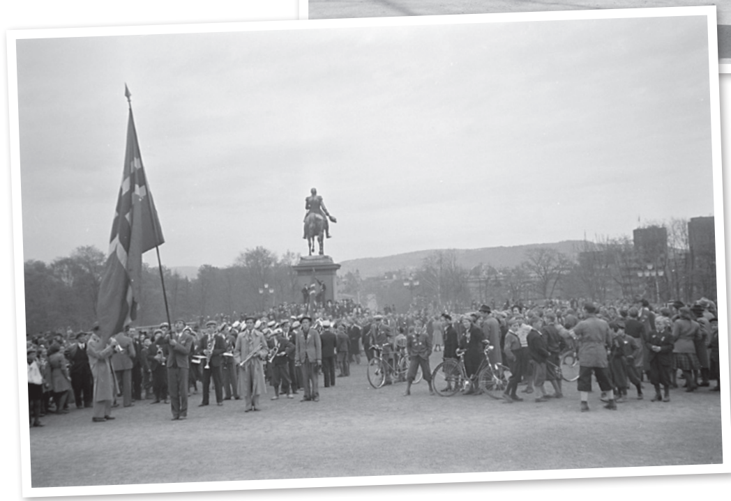
17. mai 1945.