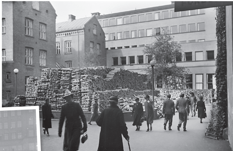
Store vedlager preget byen i krigsårene. Gårdsrommet mellom Akersgata 55 og Dittenkomplekset, høsten 1940.