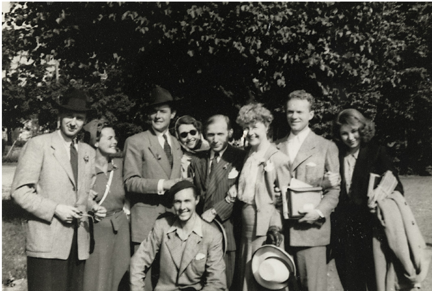
Fri norsk scene i Sverige ble dannet av en gruppe scenekunstnere som oppholdt seg som flyktninger der under krigen.