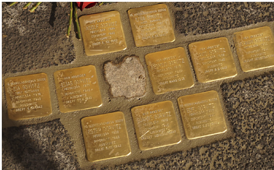
I september 2015 la Jødisk Museum i Oslo ned snublesteiner for familien Gorvitz utenfor Adolf Gorvitz gamle blikkenslagerverksted i Arups gate 2 i Oslo.