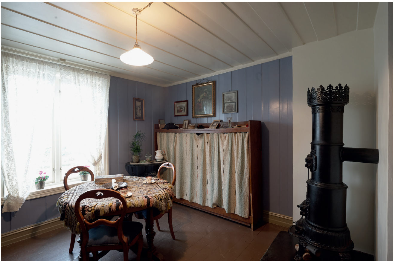
Øverst: Baby + museum + vandring = Veldig trivelig kunnskapsformidling. Her fra en tur langs Akerselva med Arbeidermuseet. Under: Arbeiderboligen Brenna i Sagveien 8 med nymalte vegger etter reahbliteringen i 2017.