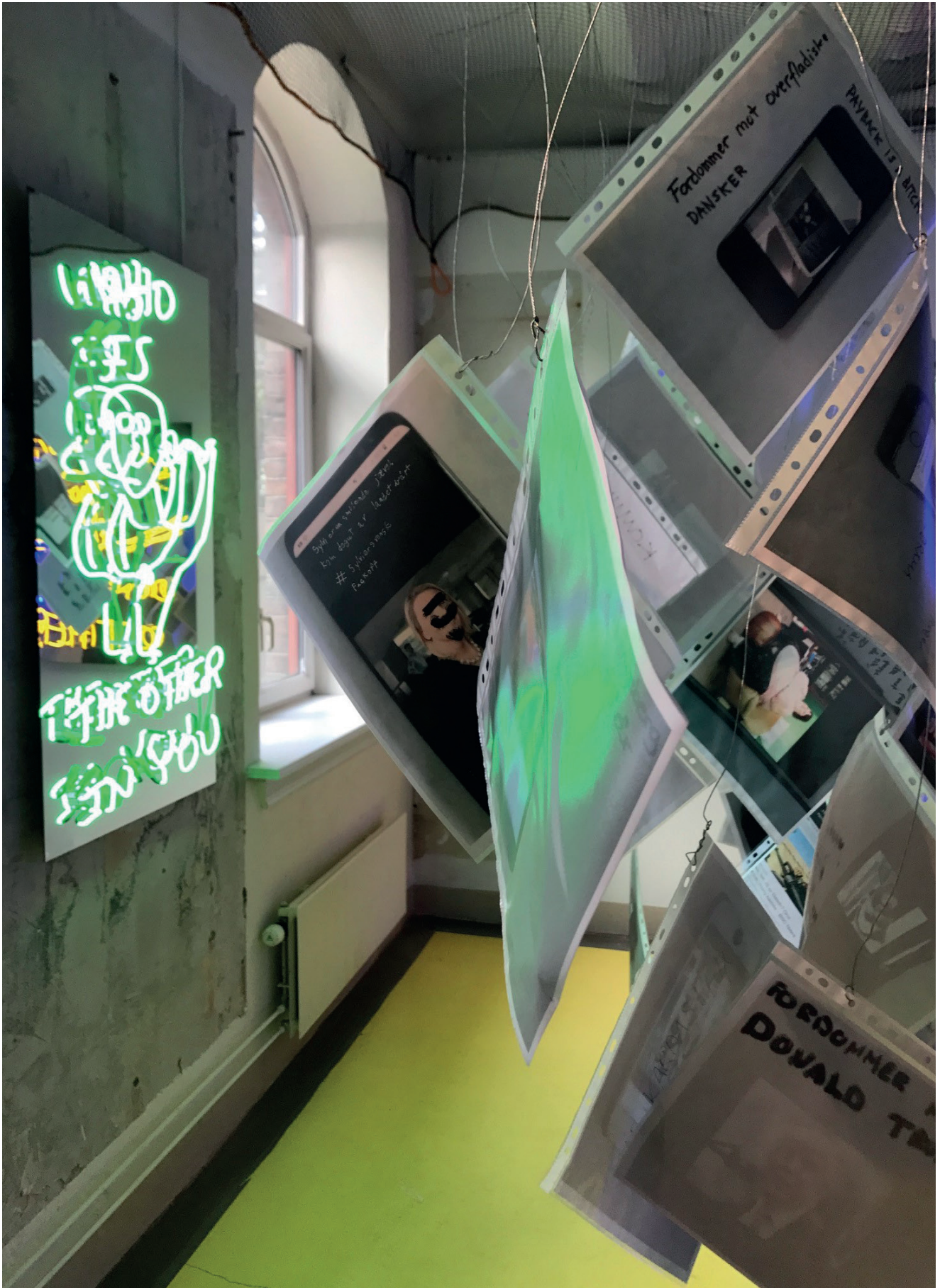
Fra utstillingen «Typisk dem». Kunstneren Thierry Geoffrey Colonels «The Anatomy of Prejudice»: en voksende skog av fordommer.