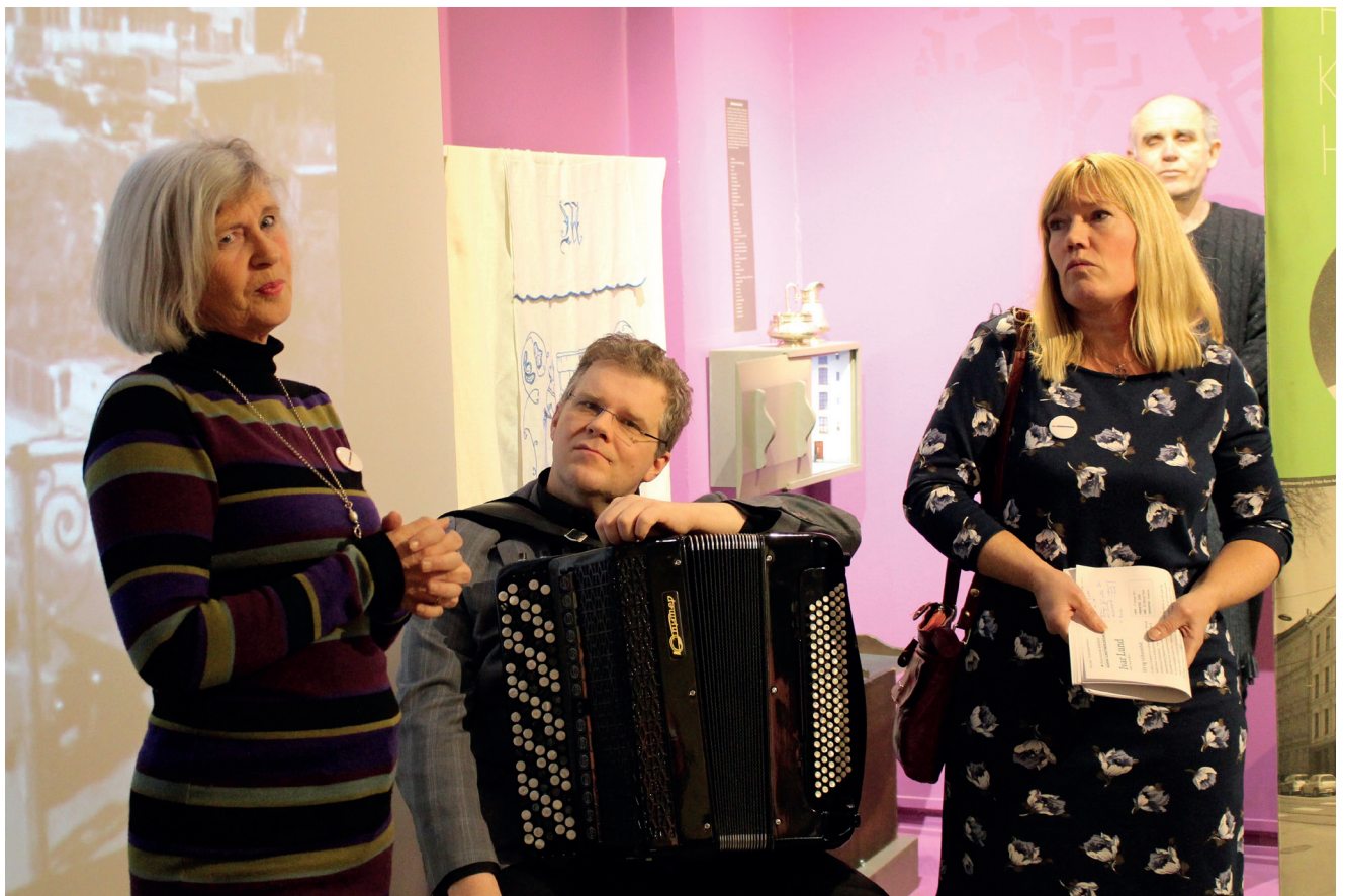
Øverst: Fra 70-tallsstuen i utstillingen «Søttallet» Under: Fra åpningen av «Kunstnerblikk på Akerselva».