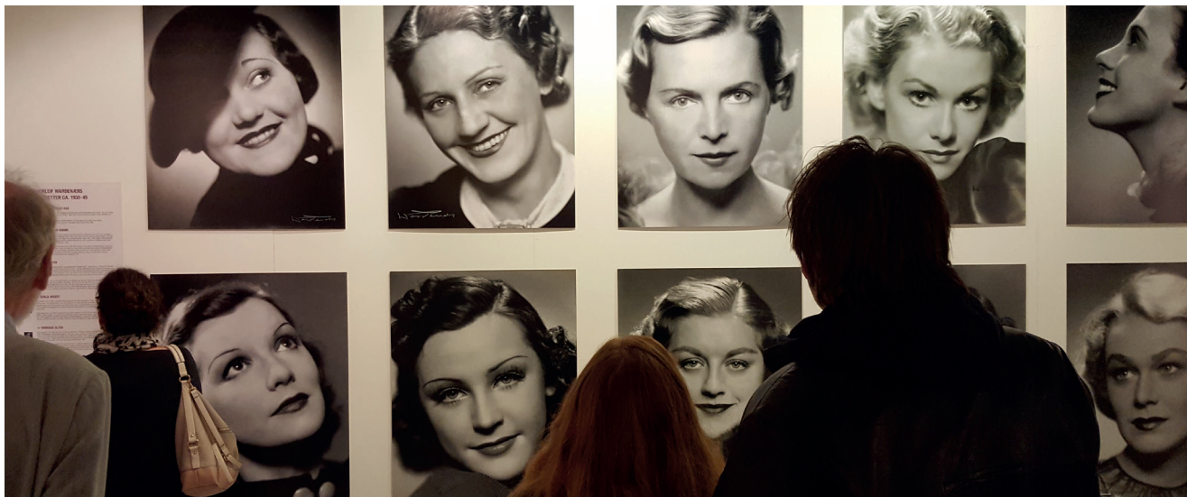
Fra åpningen av fotoutstillingen DIVA.

Oslo Museum ønsker å være til for alle som bor i byen – uansett bakgrunn. Vi ønsker at folk som bor i Oslo skal bli kjent med byen sin gjennom museet og at de skal kjenne seg igjen i museet– og oppleve at det er litt «sitt». Vi ønsker å bidra til byidentitet, og vi vil være et «involverende museum», der vi gjør ting sammen med dem vi er til for. I utviklingen av program og i gjennomføring av prosjekter har dette i 2017 vært et prioritert satsningsområde på alle våre arenaer.