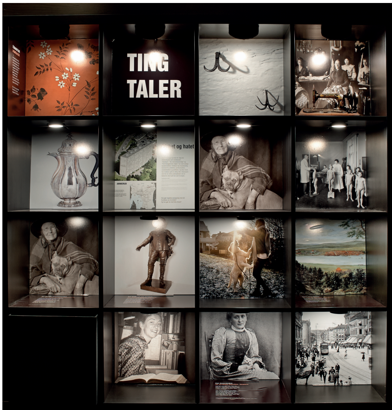
Tingenes metode resulterte i utstillingen «Ting taler».

Mål: «Museene skal forestå forskning og utvikle ny kunnskap». (Prop. 1 S 2014-2015)