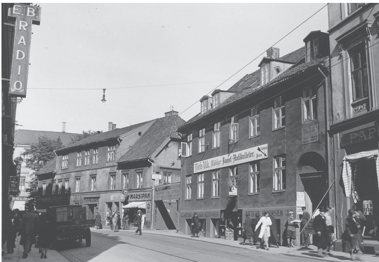
Pilestredet 16 og 18 - den såkalte Peckelgården på hjørnet av Keyzers gate. Denne delen av Pilestredet er forandret til det ugjenkjennelige. Gårdene stod der det svarte hullet av en tunnelåpning til Ibsenringen er nå. Fra å være et pittoresk og karakteristisk parti av byen er det nå nærmest et «ikke-sted».

I 2009 gikk museet sammen med bl.a. Norsk Teknisk Museum, Kulturretaten, Oslo Kommune og Maritimt Museum (nå del av stiftelsen Norsk Folkemuseum) sammen om å lage en behovsanalyse for et fellesmagasin i Oslo-regionen. En skisse til kravspesifikasjon ble levert Kulturrådet og Kulturdepartementet i 2013.