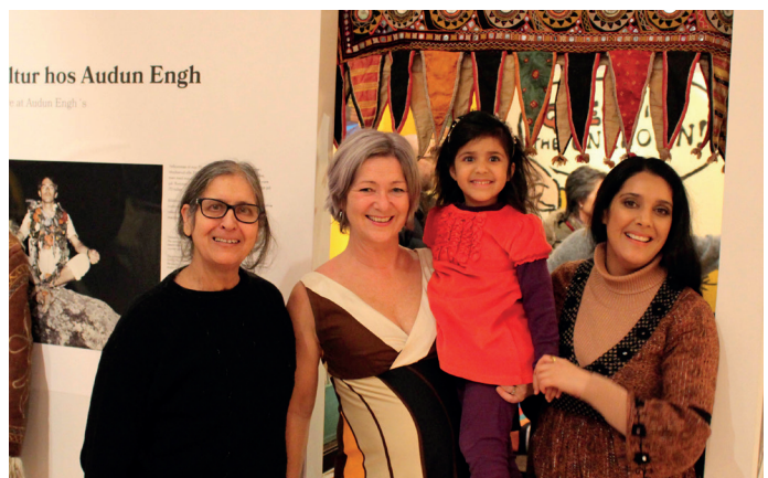
Over: Ezzari spiller under åpningen av Typisk dem på Interkulturelt Museum i juni. Under: Akerselvaraton, Gjestebud i Tøyenbekken og åpning av Søttalletpå Bymuseet.