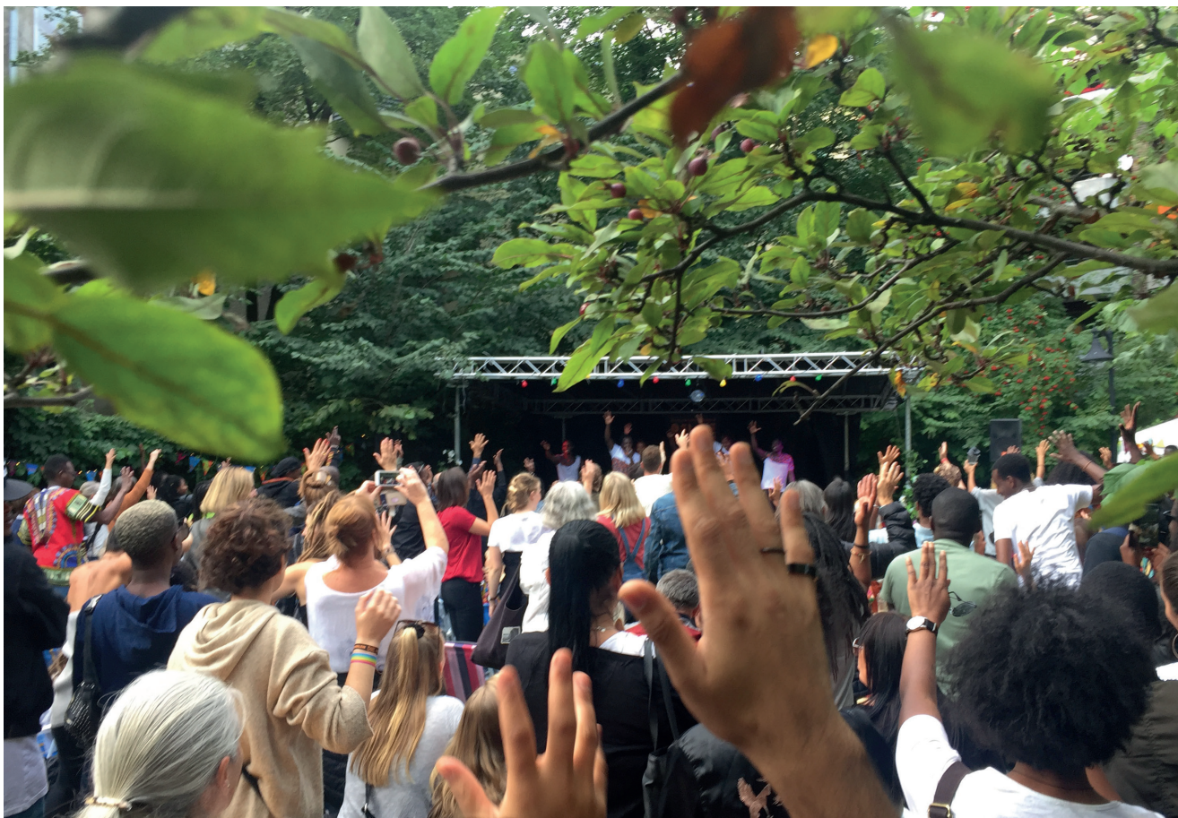
Interkulturelt Museums var for første gang arena for Oslo Afro Arts Festival siste halgen i august.