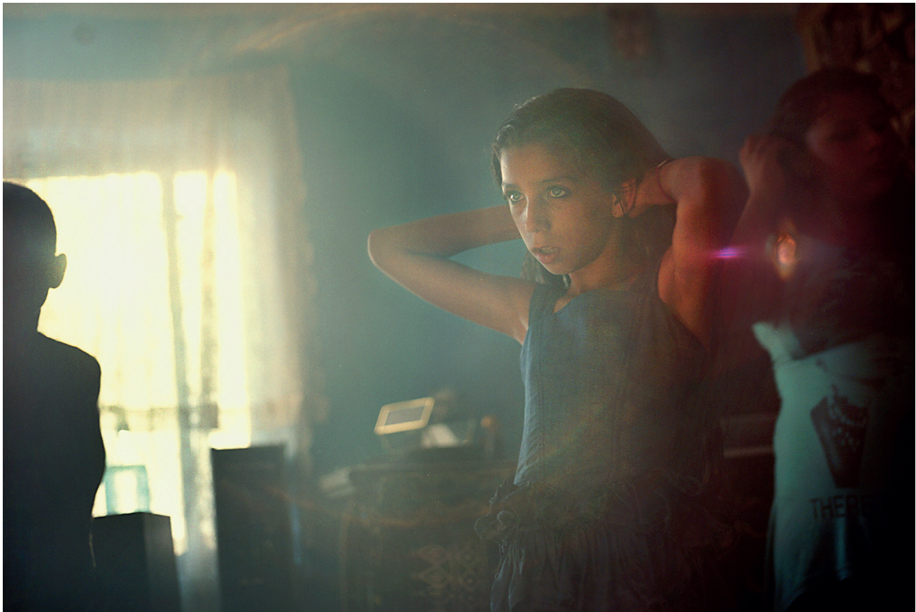
Linda Engelberths fotoprojekt fra Romania til Oslo «You can call me a Gypsy if you want to».