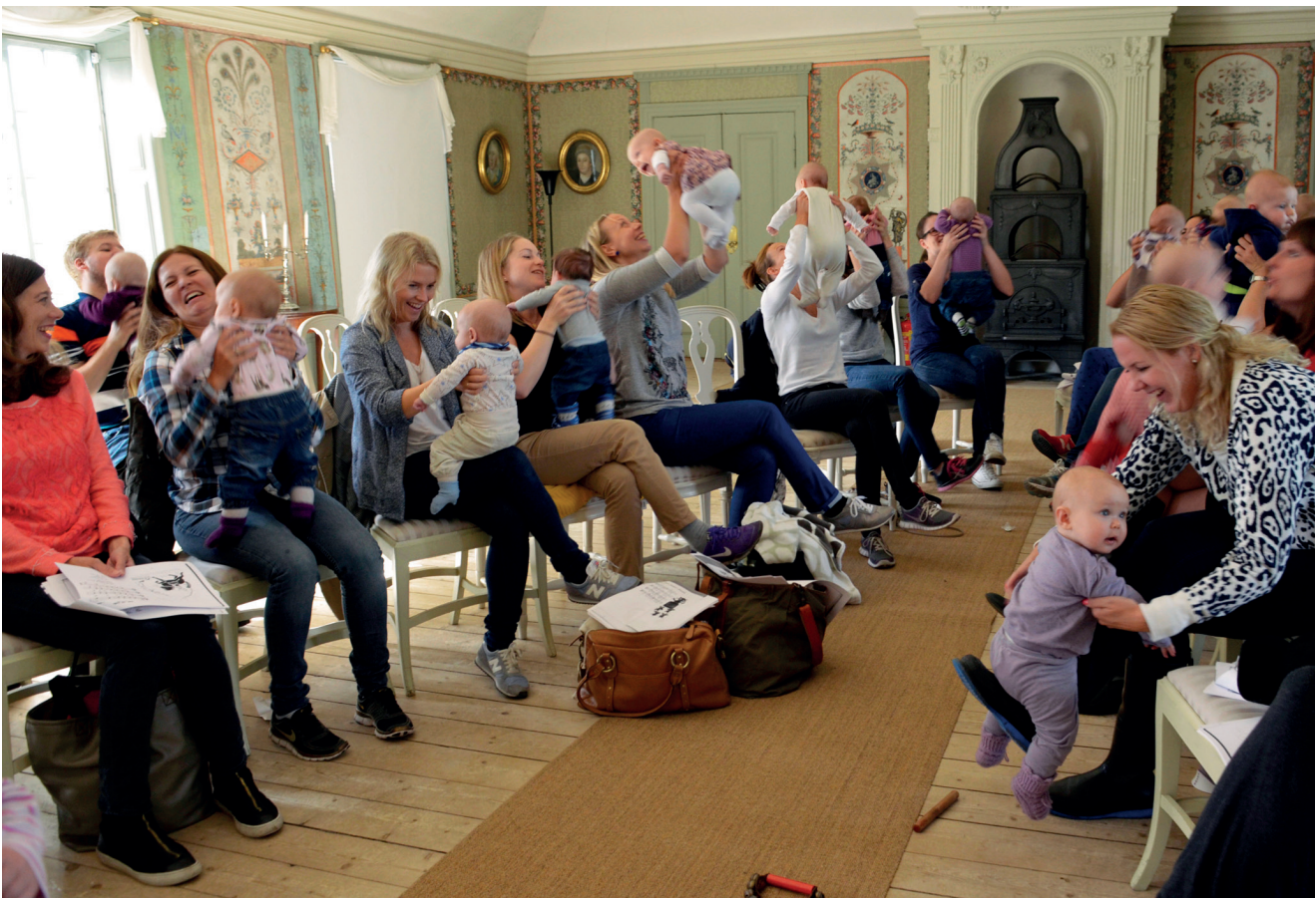
Over til venstre: Musikkfestivalen Piknik i Parken samlet hundrevis av musikkglade mennesker utenfor Vigelandsmuseet og på Frogner Hovedgård.