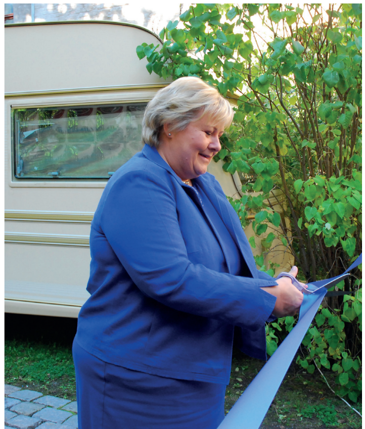
Øverst fra venstre: Julesanger i ballsalen under Førjul på Frogner. Et engasjert publikum under «Debatt om tilreisende rom» Under fra venstre: Så glad blir man av å lage lavendelposer! Erna Solberg foretar den offisielle åpningen av «Norvegiska romá - Norske sigøynere!»