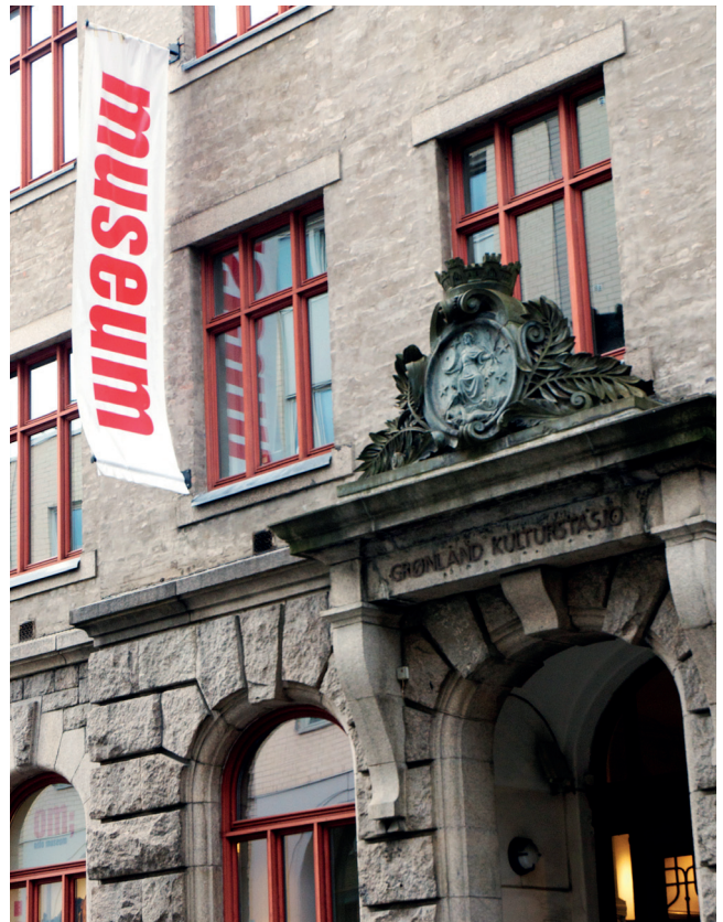
Øverst fra venstre: Arbeidermuseet i Sagveien 28. Arbeiderboligen i Sagveien 8, Stjernerommet i Frogner Hovedgård og inngangspartiet til Interkulturelt Museum i Tøyenbekken 5.