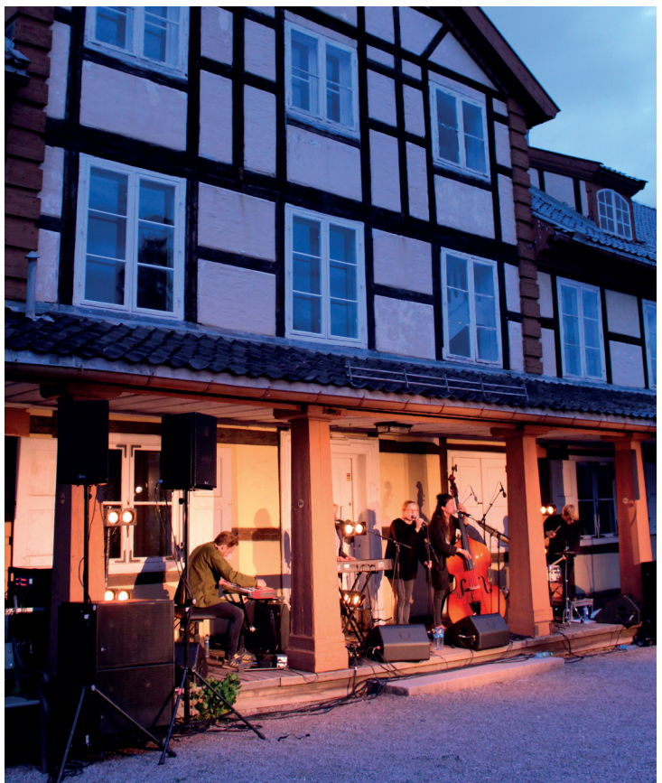
Øverst fra venstre: Arbeidermuseets utstilling. Foto: Christina Krüger/Oslo Museum. Glade damer treffes på Kafè Mathia. Foto: Christina Krüger/Oslo Museum. Under: Fra Akerselvarmaraton 2014. Foto: Siril Bull-Henstein. No 4. skapte stemning under Piknik i Parken. Foto: Mette M. Mork / Oslo Museum.