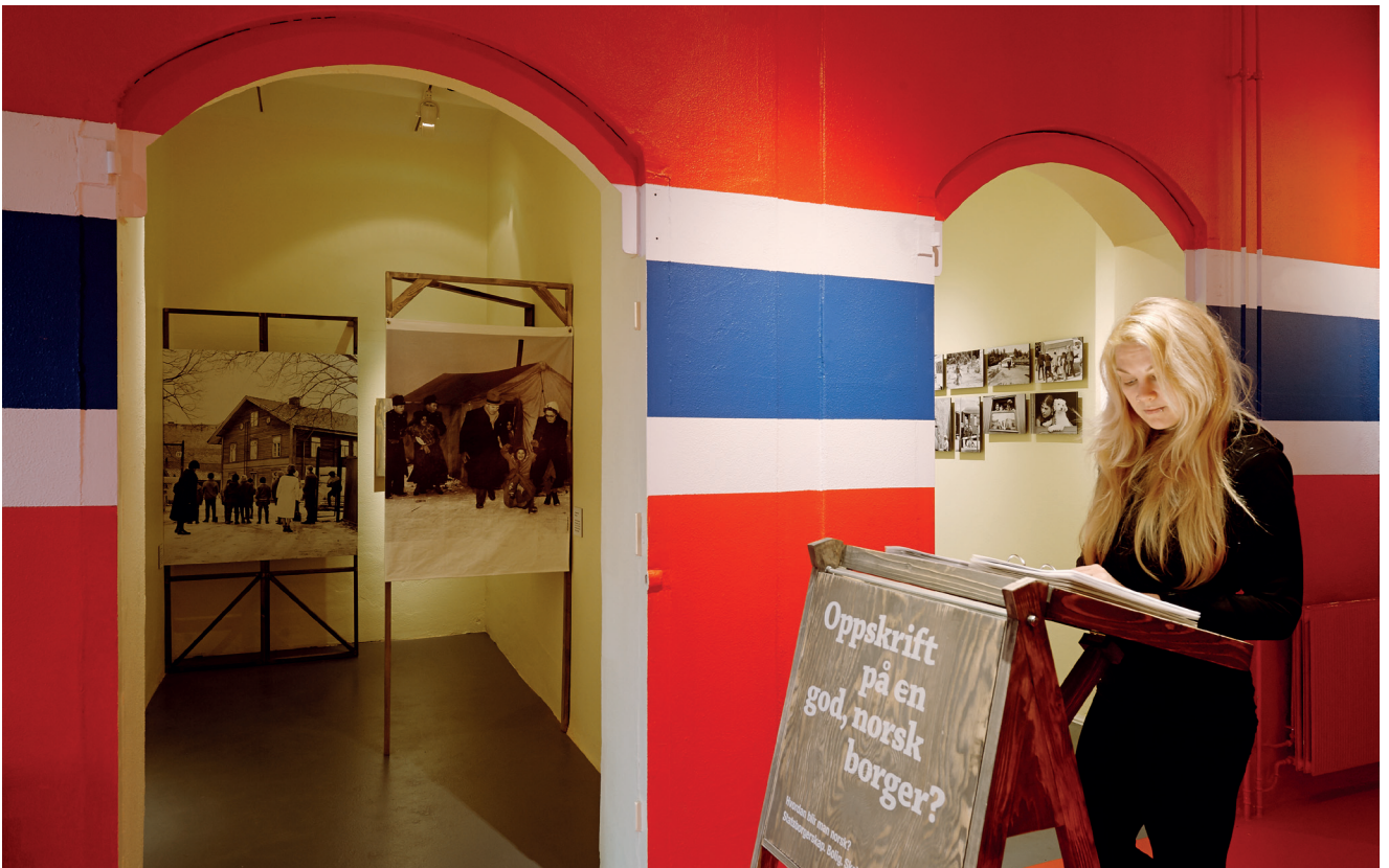
Foto fra utstillingen «Norvegiska romá - Norske sigøynere» på Interkulturelt museum..