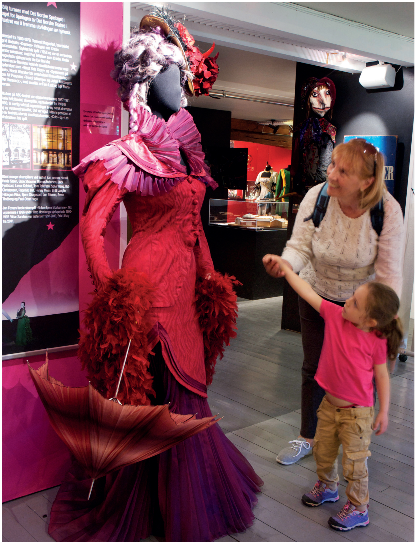
Fra Teatermuseets utstilling.