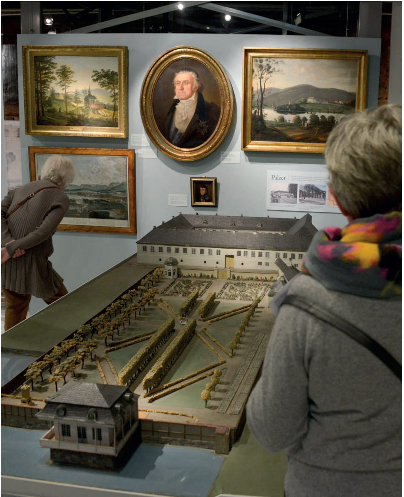
Utstillingen «Hovedstad med ambisjoner» med modellen av Paleet i forgrunnen.