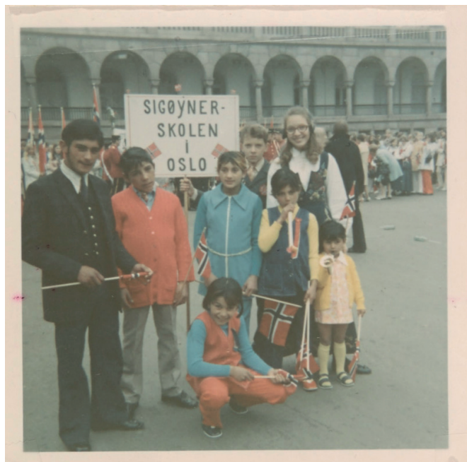
Prosjektet «Norvegiska romá - norske sigøynere» har fått tilgang til en mangde private fotografier. Her fra 17. maifeiring på Yongstorget i 1970